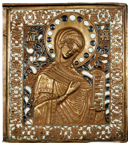
Fémikon a gyűjteményből

Ezekre a kisméretű, rézötvényzetből készült, gyakran színes zománccal díszített műre- mekre viszonylag nemrég figyelt fel a kutatás. Először a hagyományokat különösen tisztelő ószertartásúak körében terjedtek el, hiszen öntvényekről van szó, s az öntvény igen pontosan megőrzi az ősi formákat. Ám ezeket az ikonokat ragyogó színes zománccal is díszítették, s így egyedi színvilágú, csillogó ikoncsodák jöttek létre. Nemcsak esztétikai értékük jelentős, hanem ezzel szorosan összefonódva, vallásos, morális értékeket is közvetítenek. Például Dosztojevszkij Bűn és bűnhődés című regényének főhőse önként vállalt bűnhődésekor megemlékezik egy rézkesztről, mely végül is a szenvedés és a megtisztulás jelképe lesz.