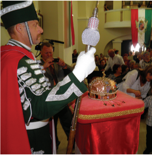
A Szent Korona Kőspallagon