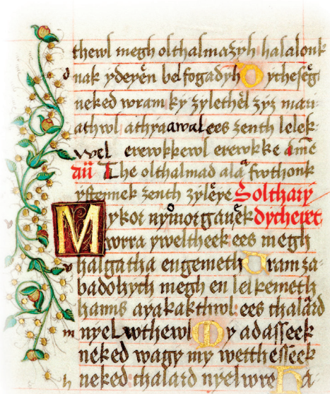
A Festetics-códex egy oldala (Országos Széchényi Könyvtár)

A tárlat kiemeli a pálos rend pécsi vonatko-