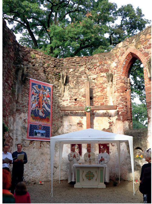
Salföldi búcsú