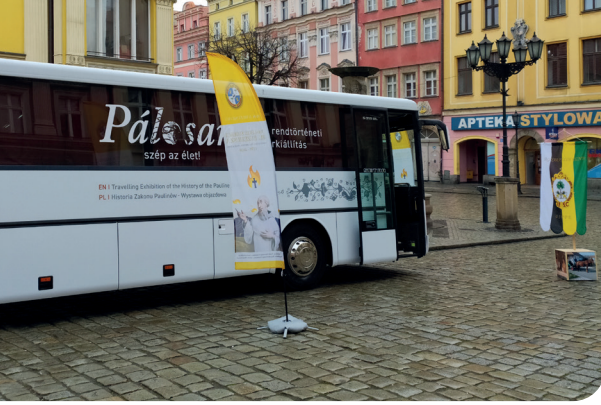
A pálos busz Swidnicában

szen addigra már megvolt a látványterv. Ő megmondta, hogy milyen anyagokat képzelt el, illetve megbeszéltük, miből készüljön el a felület. De ez nem olyan volt, mint egy lakás esetében, hiszen itt magát a felületet, a „falakat” is létre kellett hozni, ugyanakkor bonthatóknak is kellett lennie a felületnek, hogy az elektromos vezetékekhez szükség esetén hozzá lehessen férni. Nagyon jó volt az együttműködés, Máté sok mindent rám bízott, nagy szabadságot kaptam. Volt két segítségem, de a munka nagy részét egyedül végeztem el, mert sokszor egészen új megoldást kellett kitalálni. Gondolni kellett arra is, hogy mozgás közben se essen szét a busz, ne mozduljanak el és ne is törjenek el a feszültségtől a beszerelt elemek. Így egyrészt mindent rögzíteni kellett, másrészt biztosítani, hogy legyen egy kis mozgásteret minden monitornak, eszköznek. Az is fontos szempont volt, hogy amikor szét kell majd bontani a kiállítást, ne keljen kárt okozni a buszban.