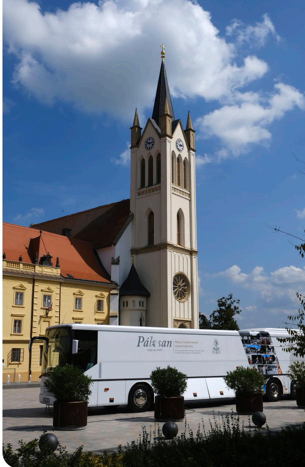
A pálos busz. Keszthelyen

Újra a buszban vagyok, mint már oly sokszor, a januári indulás óta. Ahogy a nagyvázsonyi állomáson fellepek a kiállítótér-