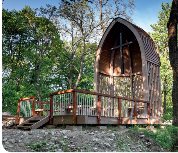
A Toronyalján épült emlékhely