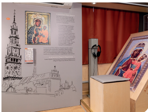
A pálos kiállítóbusz belső terei

utazókiállítást készített. Elindult a közös gondolkodás. Először saját buszban gondolkodtunk, de aztán rájöttünk, hogy ehhez mi nem értünk, így találtuk meg partnerként az Infinitours Kft-t, akik nagyon nyitottak és segítőkészek voltak.