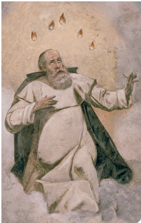
Boldog Özséb a tőketerebesi templom freskóján

„Egykor az úttalan erdőt járva-kutatva atyáink Sziklafalak mentén néhány kicsi házat emeltek, Szétszórt barlangok mélyét is jól kikutatták. Itt a kegyes remetének s papi férj, Özséb, alapítja Végre a rend házát, s a keresztnek szent neve címe. Lassan a testvérek barlang- jukat elhagyogatják, S kezdnek együtt szigorú szent zárdai életet élni.”