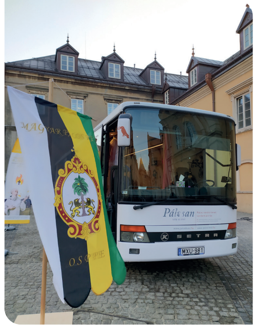
A pálos busz Jasna Górán

A buszon látható kiállítás lengyel nyelvű szövegei QR-kódok segítségével olvashatók mobiltelefonon. Sokan igénybe vették ezt a lehetőséget, de a klasszikus vezetőfüzet azért jobban tetszett a többségnek. Olyannyira, hogy – bár csak helyi használatra voltak szánva – mind egy szálig elvitték őket. Így a helyi atyák másoltak még továbbiakat az utolsó, megmaradt példányból. A látogatók figyelmét leginkább a busz hátsó részében található kis TV-szoba kötötte le, ahol az idős pálos atyákkal készült interjúkat lehetett megnézni. Csanád atya, Levente atya, József atya, Kálmán atya, Benedek és István atyák beszélnek ezeken a felvételeken arról az időről, amikor még be volt tiltva Magyarországon a pálos szerzetesi élet. Az idősebb lengyel látogatók közül többen visszajelezték, hogy nem is