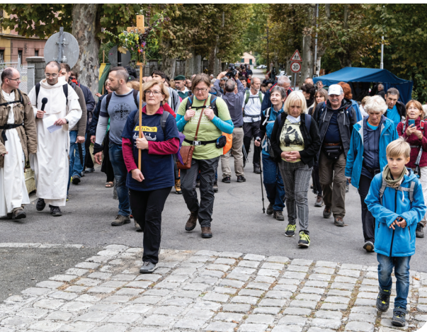
Pálos 70, 2020, Márianosztra • fotó: Török Máté