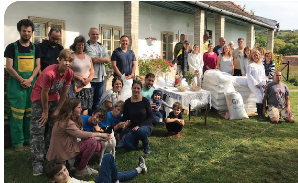
Búzavetés Herencsényben