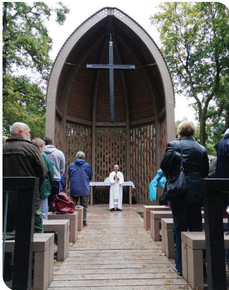
Ünnepi szentmise Toronyalján