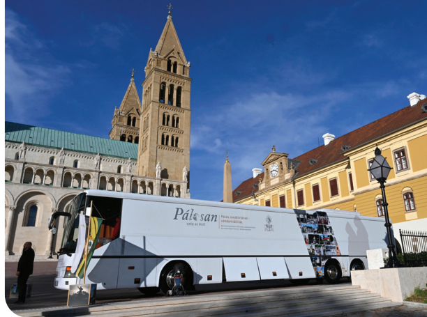
A 46. helyszínen, Pécssett