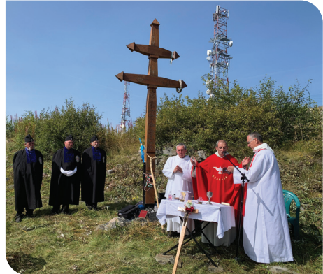
Szentmise a Hargitán • fotó: Máté Tibor

Szeptember 12-én 38. alkalommal zarándokoltak lányok, asszonyok Jászszentlászlórol Pálósszentkútra. Pál Csaba pálos atya vezetésével 22 nő vett részt a zarándoklaton. Budapestről, Kecskemétről, Kiskunmajsárról, Kiskunfélegyházáról, Kerekegyházaról, Szankról, Petőfiszállásról érkezve vitték végig szándékainkat az úton a Szűzanyához. A zarándoklatot szentmise, majd agapé zárta.