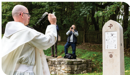
Puskás Antal megállja a klastrompusztai állomást

pilisi pálos utakat a klastrompusztai pálos templom és kolostor romjainál, a 11 órakor kezdődő ünnepi szentmisét Puskás Róbert Antal pálos tartományfőnök mutatta be. (Az átadási ünnepség napja egyúttal az éves klastrompusztai búcsú ünnepe is volt.) pálos út néven, újabb zarándokturisztikai fejlesztés nyomán több útvonalon járhatjuk a természetet Budától a Dunakanyarig, és vehetünk részt lelki utazáson is, ahogy a projekt mottója sugallja: „A természetben a Természetfelettlivel”. A Magyar Pálos Rend által megvalósított út- és jelzeshálózat kialakításában részt vett a Duna-Ipoly Nemzeti Park Igazgatóság, a Pilisi Parkerdő Zrt., a Viator Természetjáró és Kulturális Egyesület, valamint az Aktív- és Ökoturisztikai Fejlesztési Központ. A 2019 őszén megálmodott Pilisi Pálos Tematikus Út című projekt az Agrárminisztérium 14 millió forintos támogatásával valósult meg. (Lásd írásunkat az 17. oldalon)