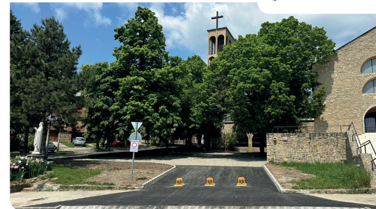
Az új parkoló Pécsen, 2023