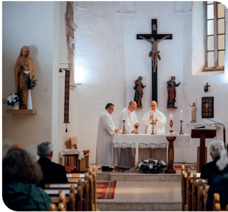
Pálos Agapé, 2023 • fotó: Mórocz Márk