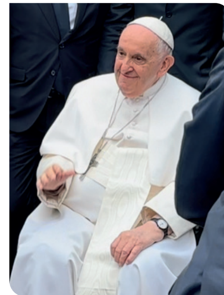
Ferenc pápa Budapesten, 2023

A harmadik nap is abban a megtiszteltetésben lehettem részem, hogy közvetlen a Kossuth téri pódium előtti szektorban foglalhattam helyet a papnövendékek, diakónusok, szerzetesek között. Ezúttal is