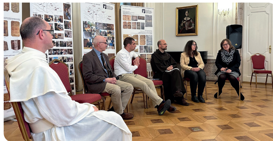
A kötet bemutatója

kitekintésű projektbe, vagyis tartalma, tanulságai egy nagyobb liturgiátörténeti összefüggésbe ágyazódnak. [...] Köszönöm a munkájukat és szívből gratulálók Önöknek!