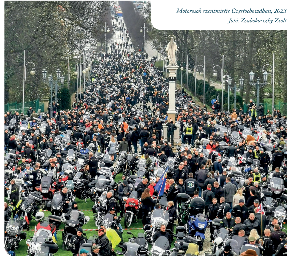
Motorosok szentmiséje Częstochowában, 2023

A MotorkerékPálosok első zarándoklata minden motoros szezón kezdetén Lengyelországba, a Jasna Górára vezet, a motorosok szentmiséjére. Már hagyomány, hogy az erdélyi és a magyarországi