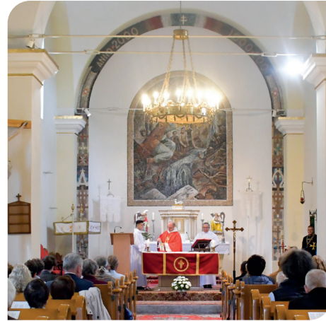
Kesztyöci búcsú szentmiséje