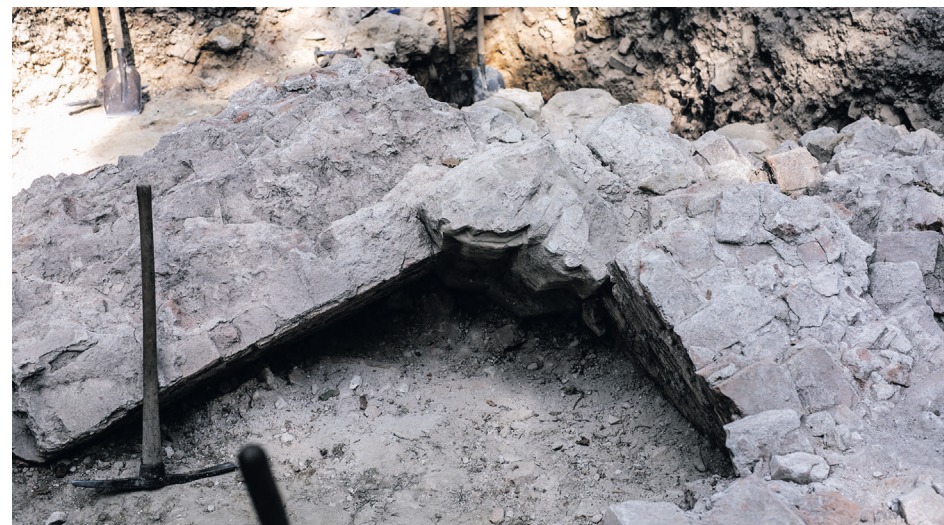
Az ásatás helyszínén