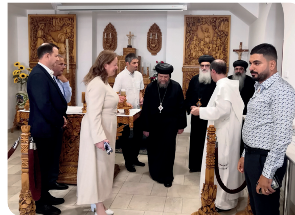
Kopt atyák a Sziklatemplomban, 2024

Örömünkre szolgált, hogy tudatosodott az, hogy a történelem bonyolult kétezer éve után Istennek ugyanaz a szándéka velünk, és ezt az ortodox és a katolikus szerzetesrendek vezetői is meghallják: „Nyissátok ki a kolostoraitok kapuit a világiak előtt”! Közös nagy örömünkre ez itt is, ott is megtörténik. Istennek legyen hála!