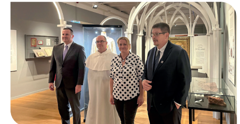
A kiállítás helyszínén

A Magyar Nemzeti Múzeum Pálosok című rendtörténeti vándortárlata a főváros, Marosvásárhely és Székelyudvarhely után megérkezett Zalaegerszegrre, a Göcseji Múzeum időszakos kiállítótermébe, ahol 2025 február végéig nézhetik meg a látogatók. A múzeumok feladata, hogy helyi közösségeket építsenek, miközben fontos