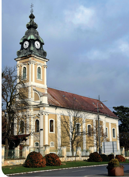
Az egykori pálos templom Sajóládon

Külső és belső felújítást végeztek a Borsod-Abaúj-Zemplén megyei Sajólád 1720-ban barokk stílusban épült, Szűz Mária látogatása titulusú római katolikus templomában, amelynek során megtörtént a tetőszerkezet cseréje, a szigetelés, a toronysisak javítása, valamint a homlokzat javítása. Kicserélték az ablakokat, korszerűsödött a vízelvezetés és a világítás, valamint felújították a kerítést, a toronyórát és az orgonákat. Március 16-án, az ünnepségen Ternyák Csaba egri érsek mutatott be ünnepi szentmisét, és megáldotta a megújult épületet. Homíliájában a főpásztor kiemelte: belső békére csak Istennél lelhetünk. Ternyák Csaba érsek elmékedésének középpontjában a napi evangélium, Jézus színváltozásának témája állt, s az érsek szólt a pálosok és Sajólád kapcsolatáról is. Kifejtette: a pálos szerzetesek évszázadokon keresztül hirdették a településen az ígét és tettek tanúságot Isten jelenlétéről. Példájuk azóta is élő. Amikor Csepellényi György boldoggá avatásáért imádkozik az Egri Főegyházmegye, Sajóládon ez az imádság még bensőségebben szól. Mert a sajlódiak tudják, hogy mit köszönhetnek a pálosoknak: nélkülük nem tértek