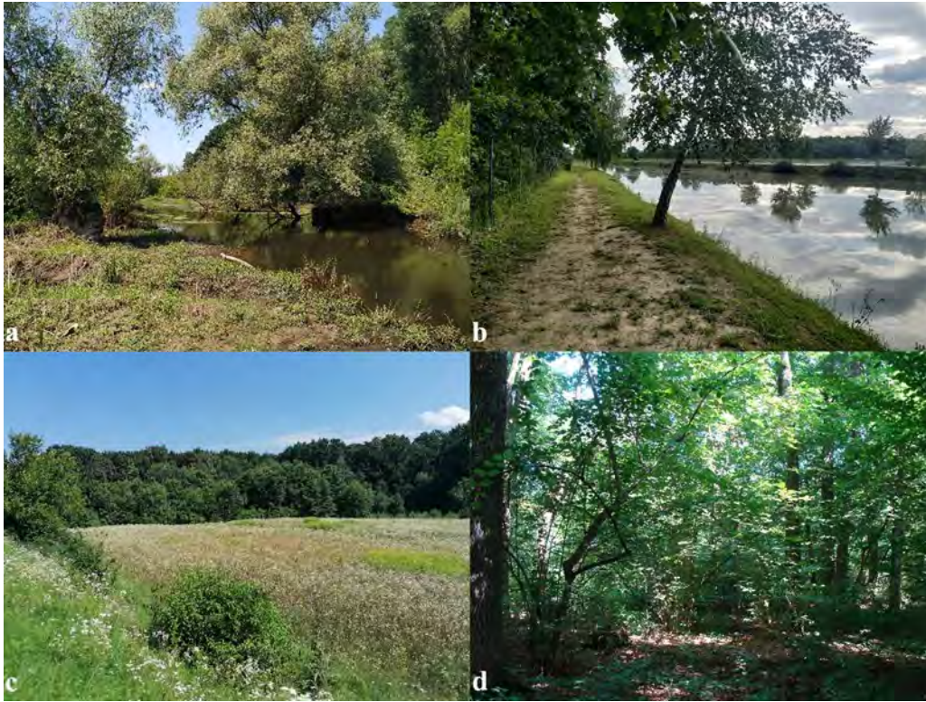
2. ábra. A mintavételi területen található élőhelyek: a = Szernye-csatorna, b = halastó, c = rét és ártéri erdő, d = ártéri erdő

Figure 2. Habitats of the sampling area: a = Szernye-channel, b = fishing lake, c = meadow and floodplain forest, d = floodplain forest