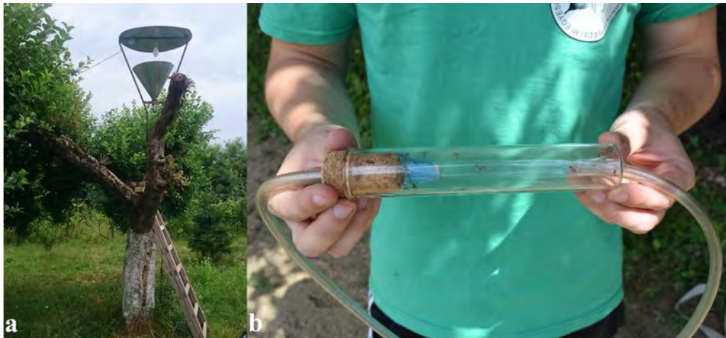
3. ábra. Alkalmazott mintavételi módszerek: a = fénycsapda, b = rovorszippantó Figure 3. Used sampling methods: a = light trap, b. insect aspirator

rovorszippantós módszerrel, 2020-ban 10 faj előfordulását tudtuk kimutatni.