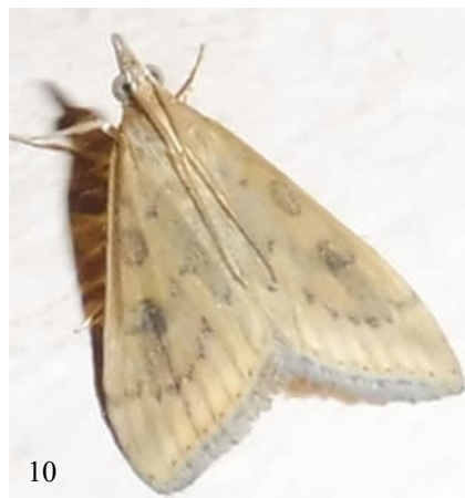
10. ábra – Fig. 10. Udea numeralis (Hübner, 1796), imágó/adult, Hungary, Szeged, 2019.XI.14., fotó/photo: Tőkés B. B., det. Pastoralis G., conf. Slamka F.

Diagnózis – Diagnosis. A szárnyak fesztávolsága 22–31 mm. Eléggé változékony faj, melyet az elülső szárnyak mintázatának különböző intenzitása okoz. Alapszíne halvány okkersárga – olykor csont- vagy krémsárga –, néha igen világos vörösesbarna; az egész szárnyfelületen gyenge vörösseszürkés vagy világos szürkésvörös beporzás észlelhető. A körfolt teljes és erős, de még sötétebb és szembeszökőbb a vesefolt; ezek a mintázat uralkodó elemei. Erősebb rajzolatú példányoknál a felső szegély alatt a tőtől a szárny egyharmadáig szürkésbarna csík, alatta a szárny kétharmadáig barnásvörös szalag látható. A külső keresztvonalból úgyszólván csak a hullám teteje maradt meg a sejt körül, gyakran azonban ék alakú sötét foltok formájában fut le az erek között egészen az alsó szegélyig. A külső szegélyen az erek végződésénél fekete pontok sorakoznak, rojtja fehéres – a markáns rajzolatú példányoké vöröses árnyalatú –, igen gyenge szürkés vá-