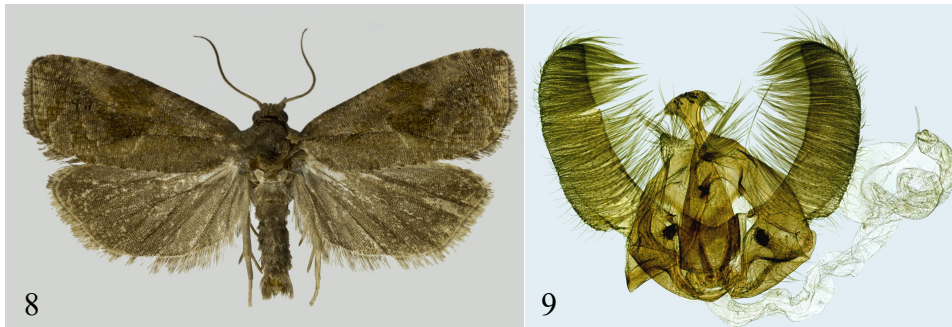
8. ábra – Fig. 8. Endothenia ericetana (Humphreys & Westwood, 1845), ♂, imágó/adult, 19 mm, Hungary, Szögliget, Szalamandra ház, 2016.VII.06., leg. Pastoralis, GP 28101 IgR., det. & fotó/photo: Ig. Richter.

Bionómia – Bionomy. Az irodalom szerint az ericetana lárvái a mocsári tisztesfű ( Stachys palustris ) és más Stachys fajokon ( S. sylvatica ?), valamint a mezei menta ( Mentha arvensis ) szárában és gyökerében fejlődnek. Az imágók július – augusztusban repülnek, a mesterséges fény vonzza őket.