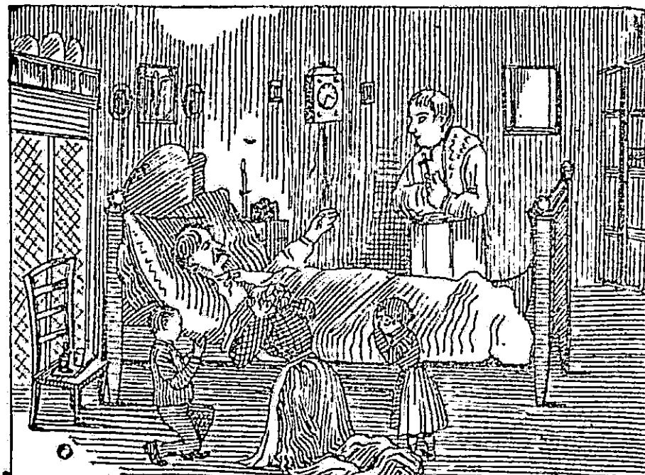
Azt mondta: „Nekem semmi sem használ már, hagyjatok békeben meghalni!”

Mikor a faluban híre ment a FELLER-féle Elsa-Fluid csodás gyógyerejének, a betegek mind rendelkezten kifizető házi szerből és mindnyájan meggyőződtek, hogy a valódi Feller-féle Elsa-Fluid teljesen s gyorsan gyógyít rheumát, dagadt lábakat, vesebajt, daganatokat, nyílalást, lázt, közhényt, láb- és kézbenulást, szivdobogást, légzési zavarokat, fülzugást, fogfájást, a száj rossz szagát, különösen szemgyöngöcséget és idegbajt, gége- és torokbetegségeket, skrofulózist, sebeket, megfagyott testrészeket, orrbánczot, püرسnéseket, szemölcsöt. Az emberek a FELLER-féle Elsa-Fluidot a gyermekeknek adták sárgaság, láz, bányahimlő, rekedtség, köhögés, giliszták ellen, bekenték FELLER-féle Elsa-Fluid-dal, ha gyermekeknek köhögés volt, testükön vagy arcukon, sőt ha ótvaros volt a fejük, és mindig használt a Feller-féle Elsa-fluid.