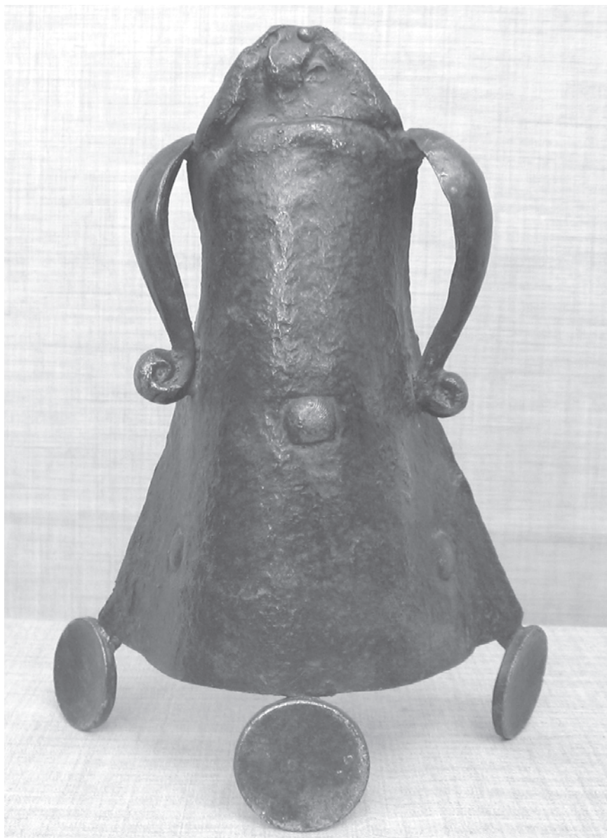
A menyecske - 22cm x 16cm x 10cm, bronz, 2002