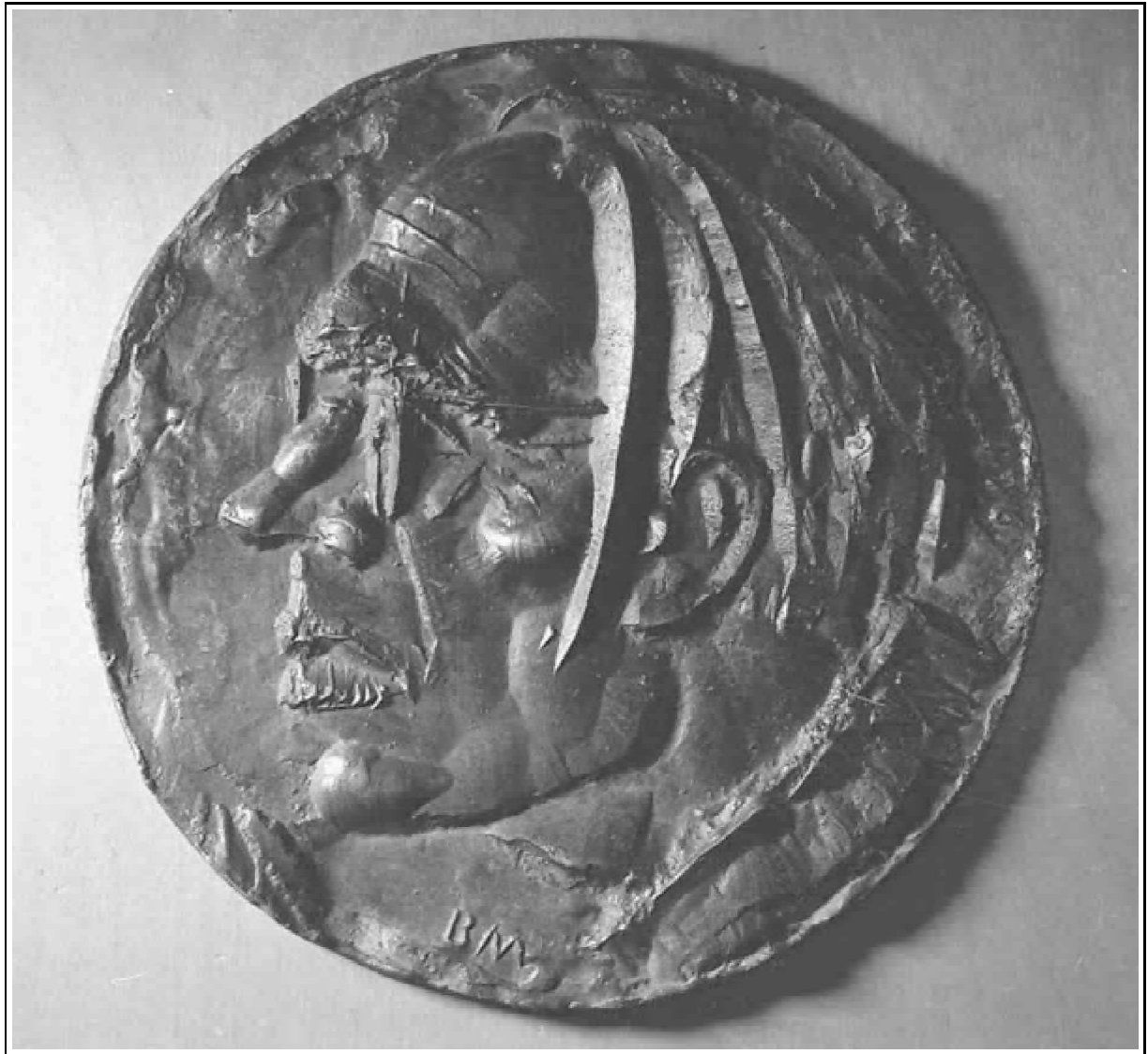
Borsos Miklós: Szabó Lőrinc, 1964, bronz, Ø 22 cm