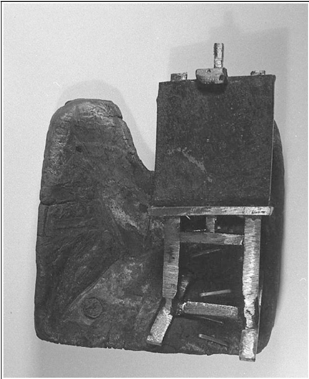
íj. Szlávic László: V.D. születésnapjára – Műterem III, 2002 fa, vegyestechnika, 9x9 cm

Külön kell szólni a Biennále nagydíjáról, amely Ferenczy Béni (1890–1967) kiváló szobrász és érmész nevét viseli, Győr-Moson-Sopron megye Önkormányzatának nagydíjaként, mintegy felvállalva és példának állítva a művész életpályájának gazdagságát, munkásságának, emberi és szakmai tartásának tisztaságát, orientáló erejét. Ferenczy Béni alkotói pályájának olyan részét képezik érmei, amelyet a klasszikus alkotói módszer, az igényesség és a szakmai sokoldalúság mellett a humánus, a finom érzékenység jellemzi. A nagydíjjal kitüntetett kiállító művész megkapja a díj mellé Ferenczy Béni „Pro arte” c. érmét – első alkalommal a művész özvegyének jelenlétében történt mindez.