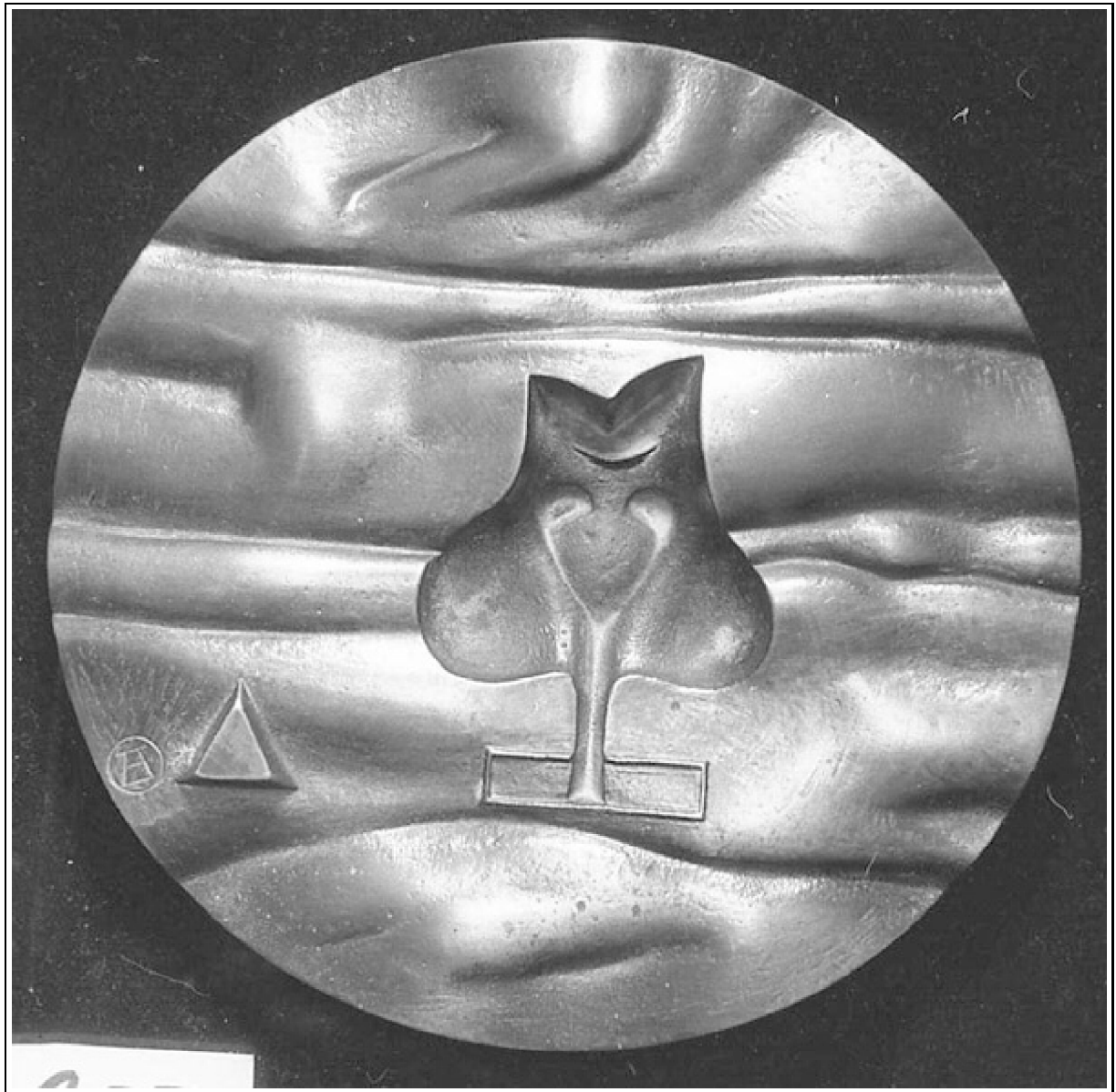
Tornay Endre András: Menny és pokol X, 1992, bronz, Ø 13 cm

185 1977–2005 között 15 országos Érembiennále került megrendezésre; alkalmanként 90 körüli kiállító szereppel, kiállításonként 300 körüli munkával. A Lábasház nagy termében a jól variálható tárolókban változatosan lehet csoportosítani a műveket, a stíláriális összetartozásokat, tendenciákat, egy-egy alkotó műveit együtt tartva – jól segítve a látogatóknak a mind elmélyültebb megismerést, eligazodást, az értékrendekhez közeledést.