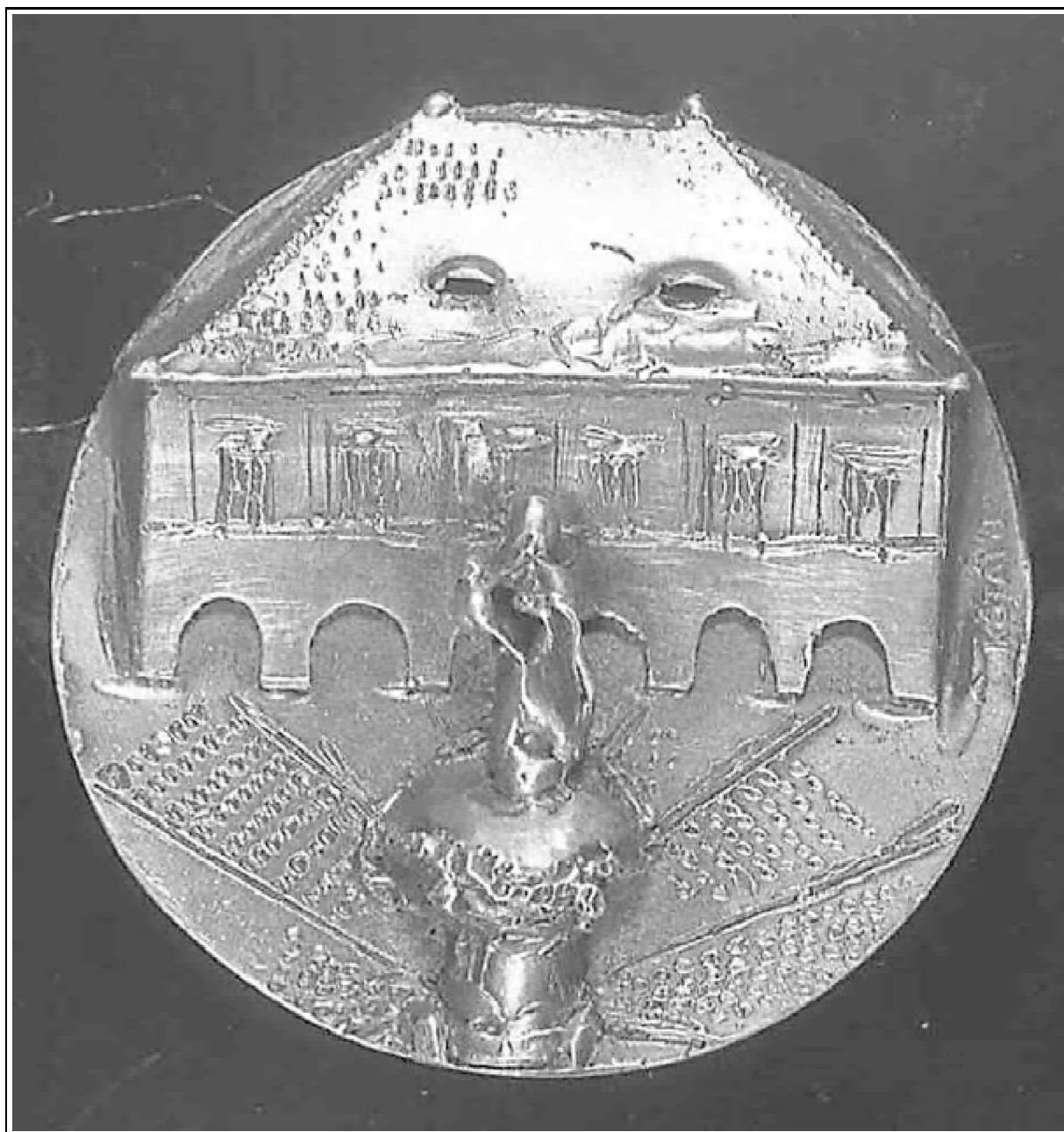
Kótai József: Lábasház, 1983, vert ezüst, Ø 4,5 cm

1977-ben – szerencsés egybeeséssel – Budapesten rendezték a FIDEM kiállítását (az éremművészek nemzetközi szervezetének bemutatóját), amelynek külföldi vendégei meglepetésükkel az Érembiennálét. A visszhang meglepetésről, pozitív elismerésről szólt, s többek között ez is hozzájárult ahhoz, hogy ezen fontos nemzetközi rendezvényen hazánkat megkülönböztető figyelemmel fogadják napjainkig. Bizonyíték erre az is, hogy azóta már két alkalommal (1994-ben és 2002-ben) ismételten hazánk lehetett fóruma ennek a jelentős nemzetközi kongresszusnak és seregszemlének.