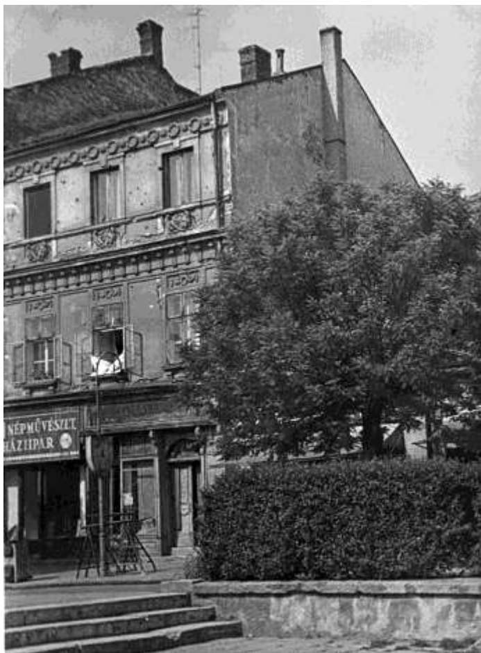
8. kép. A felújítás előtti állapot 1959-ben