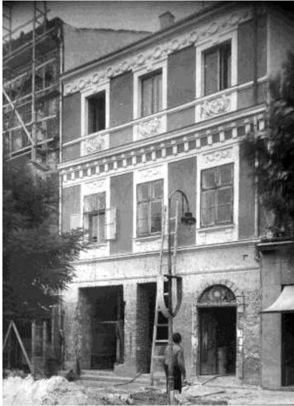
9. kép. Ritka pillanatkép: a Schármár-féle kirakatot már elbontották

Az 1966-ban, az „amnesztia hetén” készült fotó baloldalán megjelenik az épület felújított homlokzata, de rálátunk a többi, mellette sorakozó Lenin körúti házra is (10. kép). 62 A körutat ellepő gépkocsi áradat az 1956-ban emigrált honfitársaink tulajdonát képezte, hiszen abban az időben ennyi nyugati autó nemhogy Sopronban, de még a megyében sem volt. A hazlátogatók a gyermekeknek már Sopron határában cukorkákat, csokoládét osztogattak. Az üzletek fölötti reklámfeliratok az üzletek profilját hirdetik – Népművészet, Háziipar, Papír-írószer, Édesség, Konfekció –, a valamikori bérlők nevei teljesen eltűntek. A régi képeslapokon is látható kockakő burkolat helyén, a fotón aszfaltburkolatot látunk. A Várkerület aszfaltozása, máig is meglévő kialakítása, közterületeinek rendezése a második világháború éveiben készült el.