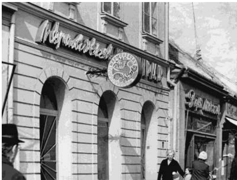
11. kép. A Népművészet, Háziipar íves üzletnyílásai 1975-ben

kapcsolatos munkákhoz a tudományos kutatás személyi és anyagi feltételeinek biztosítását, az építészeti tervek elkészítését, a helyreállításhoz szükséges kivitelezői háttérrel és évenként átlag 1 millió Ft anyagi hozzájárulást.