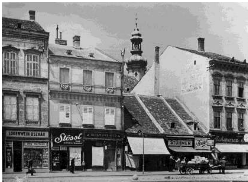
6. kép. Várkerületi utcakép az 1930-as években