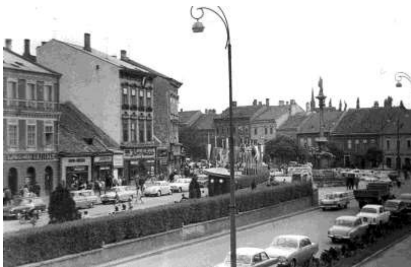
10. kép. A Lenin körút 1966-ban, az amnesztia hetén

A következő kis építési mozzanat az épülettel kapcsolatban 1975-ben történt. 63 A Népművészeti és Háziipari Szövetkezeti Vállalat megrendelésére a dombóvári Vegyipari Szövetkezet világító reklám emblémát kívánt elhelyezni az épület homlokzatára. Az Országos Műemléki Felügyelőség a műemléki hatósági hozzájárulást megadta, a reklámberendezés az üzlet bejárata fölé kikerült. A közeli fotón jól kivehetők az 1960-as felújítás, átalakítás részletei, a homlokzat színezése itt már újra egytónusú (11. kép).