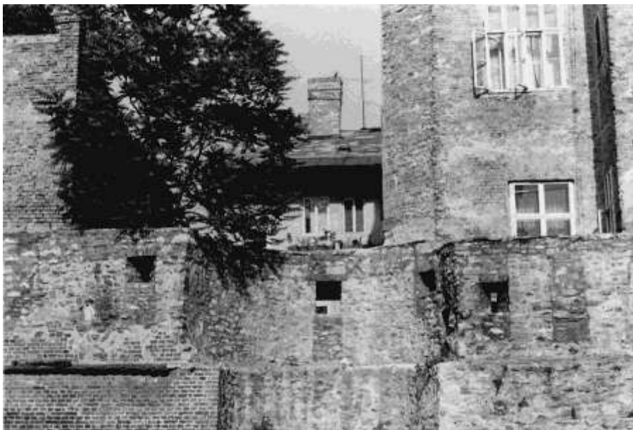
12. kép. A Lenin crt. 70. udvari nézete az elbontott szomszédos épületszárnyakkal (1981)

Az 1991. évi XXXIII. tv. 3. paragrafusára hivatkozva Sopron polgármestere a Győr-Moson-Sopron Megyei Vagyonátadó Bizottságtól kérte az állami tulajdonban lévő Várkerület 70. számú műemlék ingatlan önkormányzati tulajdonba adását. 1993. december 21-én kelt határozata alapján a Bizottság az épületet néhány feltétellel Sopron Megyei Jogú Város Önkormányzata tulajdonába adta. 68 1997-ben a Várkerület 70. számú épület 209 m 2 -es telkét megosztással módosították 111 m 2 -re. Az épülethez tartozó telek immár csak a külső határoló falai által elfoglalt terület, a többit leválasztották a készülő várfalsétány közterület számára. 2000-től az ingatlan társasházi tulajdon. 69