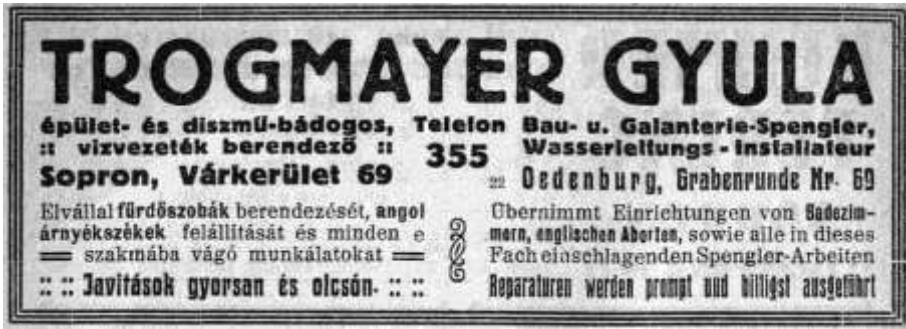
5. kép. Trogmayer Gyula hirdetése 1923-ból

Trogmayer Ödön, Ottó öccse 1894-ben született, tizedik gyermekként. 28 Ő nem követte az atyai mesterséget, nem kefekötőként dolgozott. Iparengedélyét 26 évesen, 1920-ban váltotta ki, üveges-ipar szerepel rajta. A jegyzet rovatban Várkerület 69. olvasható, így egy rövid ideig ő is az épületben dolgozhatott. Az 1923-ból származó számla fejlécéből kiderül, hogy ekkor már a Torna u. 6. szám alatti üzletében üveges, valamint üveg- és porcelánkereskedést működtet. A számlát üvegezési munkáról a Füredi-Cavallár cégnek állította ki. 29