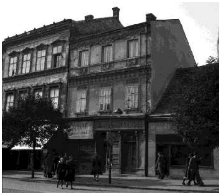
7. kép. A Lenin crt. 70. 1952-ben