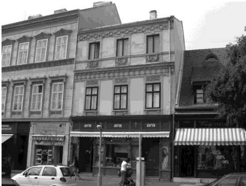
1. kép. A Várkerület 70. számú műemlék épület és környezete (2012)