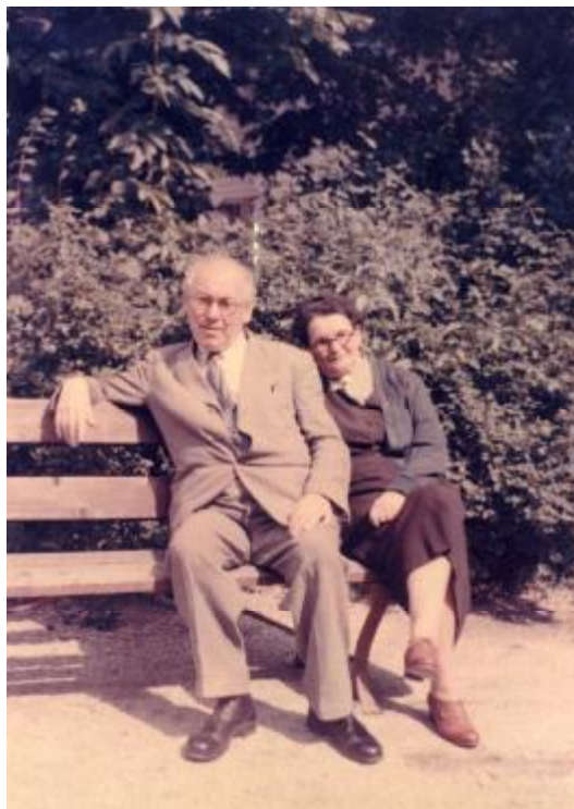
3. kép. "Peer Gynt és Dsidsia", 1950. k.

múlva visszajön tanulni. Volt két Pozsony megyei földbirtokos-fiú, akiknél a Polgár egy nyáron át nevelősködött, ezek anyjokkal együtt eljöttek búcsúzni. Az anyjuk afelől érdeklődött, nem lehetne-e idehozni a zárdába egy fiatal megkeresztelkedett zsidó leány ismerősét? Mintha a régi élet minden emlékestül le akart volna szakadni, úgy siettek le a színpadról a szereplők.