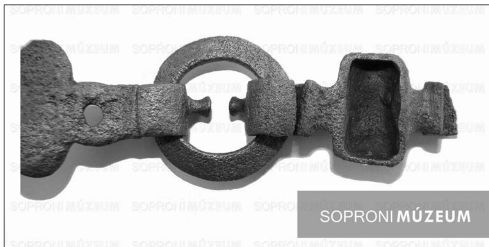
5. kép. Az összekötő tag üreges hátsó része és az összeillesztés technikája

tehetőleg szabadon csüngött a combok előtt. 15 Ezekből következően mai fogalmainkkal élve jó közelítéssel S–M körméretű csípő jöhet számításba – amennyiben használati darab és nem csak kifejezetten az esetleges temetkezés számára készített darabról van szó. Persze figyelembe kell venni, hogy a megmaradt hosszúság egyáltalán nem biztos, hogy megegyezik az eredeti hosszal. A találás fentebb ismertetett körülményei miatt egyáltalán nem zárható ki, hogy komplett rész (részek?) hiányoznak ma belőle.