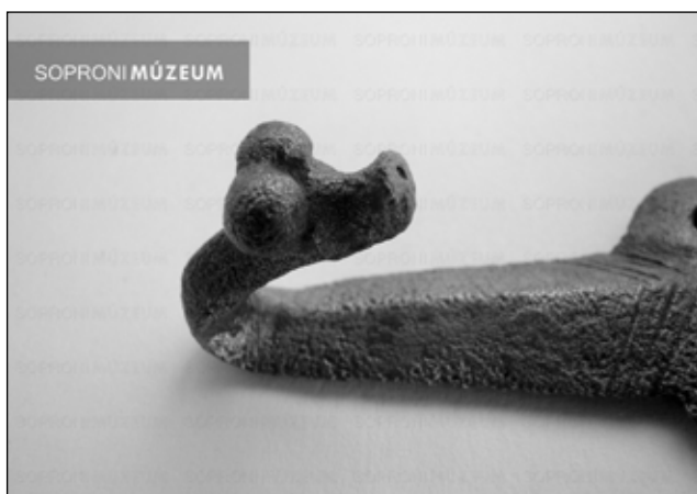
2. kép. Zoomorph kapcsolótag, alsó részén ferde bevágásokkal

hozzáillesztés után fogóval összeszorították őket. A karikák közepe felé mutatva, kisebb, enyhén spulnialakú kiálló rész látszik. Ellaposodó végük minden esetben jól eldolgozott, így biztosan nem öntési maradványok, hanem szándékos díszítőelemek (3–5. kép).