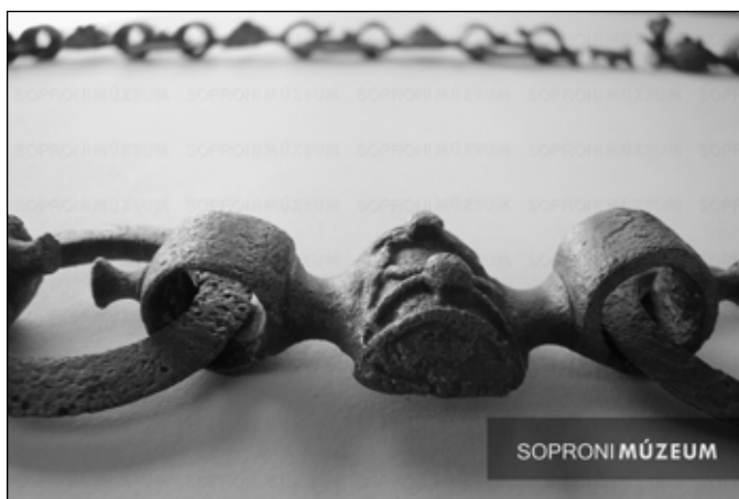
3. kép. Az összekötő tag díszítése