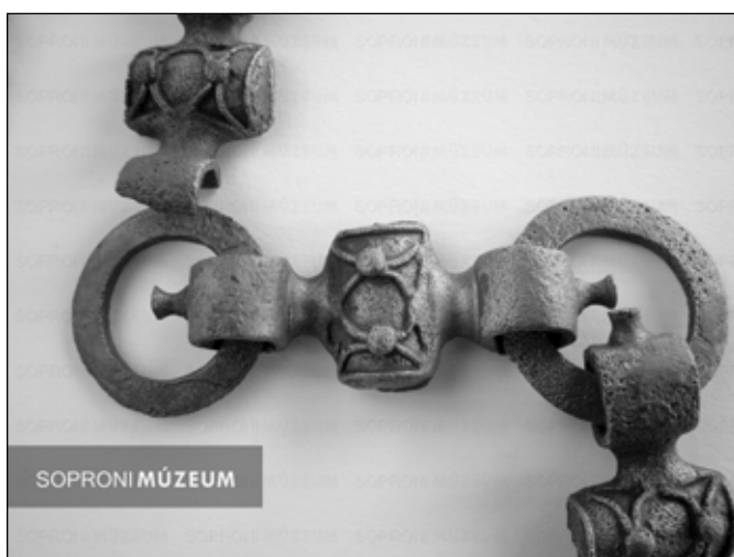
4. kép. A feltehetőleg azonos öntőmintában készült összekötő tagok nagyfokú hasonlóságot mutatnak

helymegjelölés nélkül említésre került még a tejesfazék-szerű edény is, ami a jelentés szerint szintén teljesen szétmállott. 7 Ezek szerint tehát a tálon és az övön kívül a többi lelet a találáskor elpusztult. Erre utal a szöveg is. 8 A bizonytalanságot növeli, hogy az egyetlen megmaradt leírókartonon a hármasszám szerepelt, így kénytelenek vagyunk feltételezni, hogy a „szétmállás” a valóságban inkább darabokra hullást jelenthetett.