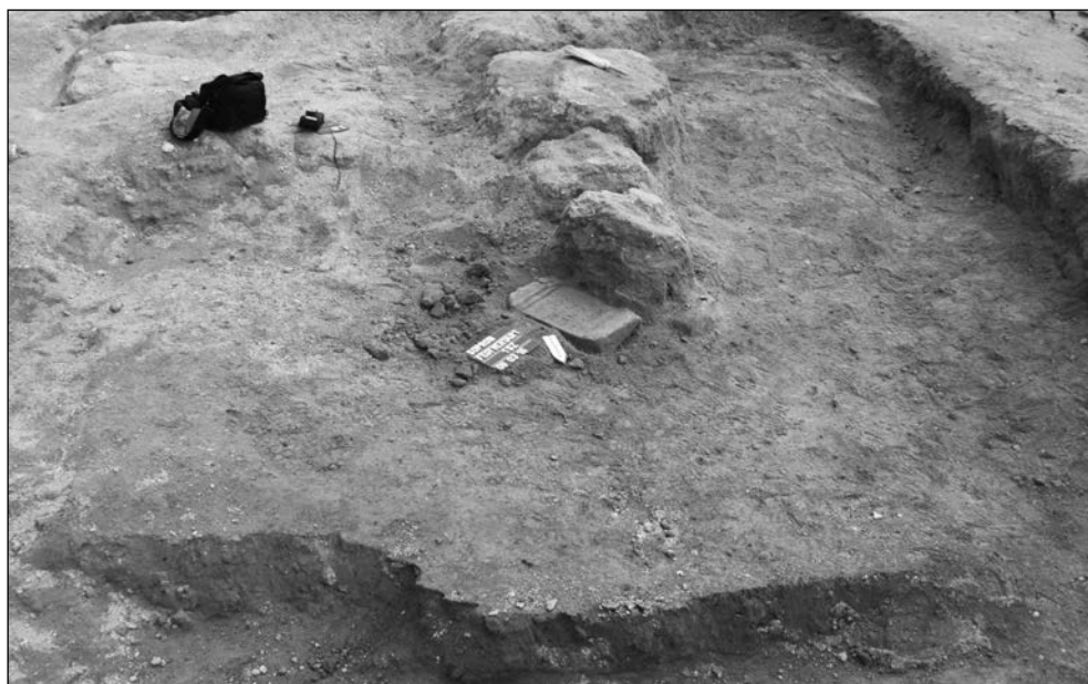
2. kép. A scarbantiai Minerva oltár megtalálásának kontextusában, 2009

még 1969 előtt egy további római kori felirattöredéket, amelynek múzeumi kartonján az olvasható, hogy „az írott lap oldalán és alsó felületén olyan jellegű a mész, mint a vörös sáncot belülről támasztó falban.” 8