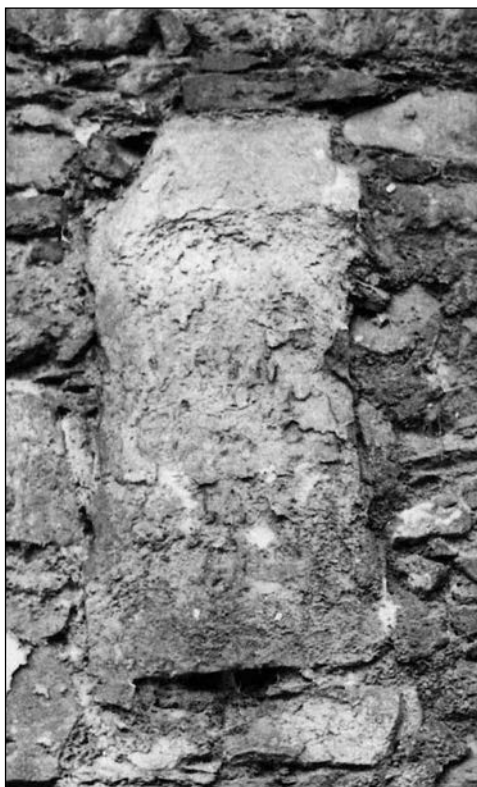
9. kép. A Szent Orsolya rendház területén 1737 előtt talált Nemesis oltár a kert kerítésfalába építve egy 1972-ben készült fotón (SOM-AF 29.738)

építése előtt állították, és előkerülésének kontextusa sem ismert, a Minerva oltárral és a fürdővel való közvetlen kapcsolata ezért egyelőre nem igazolható. Minerva és Nemesis közös kultuszára sem rendelkezünk adatokkal.