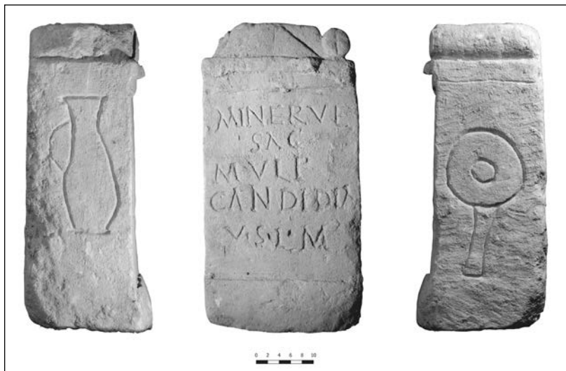
5. kép. A Minerva oltár előnézetének és két oldalának fotói