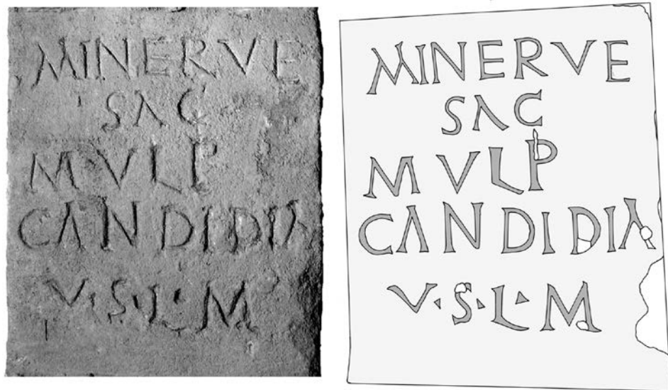
6. kép. A Minerva oltár felirata (rajz: Mráv Zsolt)

Az oltár feliratát az oltártörzs homlokzati oldalára vésték (6. kép). Elővonalazást nem alkalmaztak, a sorokban a betűk ordinatiója ezért egyenetlen, a betűmagasságok különbözőek és a sorok nem vízszintesek. A sortávolságok sem azonosak, az 1-2. sor között 1,2 cm; a 2-3. sorok között 1,5 cm; a 3-4. sorok között 1,2 cm; a 4-5. sorok között 2,5 cm. A 2. és 5. sorok középre, a 3. sor balra rendezett. A feliratot kevésbé gondosan, de mélyen és határozott kontúrokkal vésett betűkkel írták. A betűk magassága: 3,4 cm (1. sor, de a sorkezdő M 4,2 cm); a 2. sorban az S betű 3,5 cm, az AC betűk azonban 3,2 cm; 3,5-4 cm (3. sor); 4,6-4 cm, a sor vége felé csökken (4. sor, az utolsó előtti I 3,2 cm); az 5. sorban a V betű 2,5 cm; az S betű 3,6 cm; az L 4,2 és az M 4,4 cm magas. Az M (1. sorban), az A és az L betűk formái az actuaria betűkre emlékeztetnek. Az 1. a 3. és az 5. sorokban az M betűket eltérően vésték: az 1. sorban az M széttartó szélső száakkal írt actuaria formájú betű, míg a 3. sorban aszimmetrikus vonalvezetésű, az 5. sorban pedig a szabályos kapitális betűket idézi. Az A betűk szárai közötti vízszintes összekötő vonalak hiányoznak. Az L betűk talpa jobbra lefelé ferde, amely az 5. sorban enyhe hullámvonalat követ. Szóelválasztó jelek csak az 5. sorban látszanak, ahol mélyen vésettek és felfelé álló háromszög alakúak.