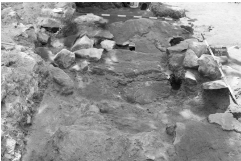
7. kép. A soproni vörössánc szerkezete a Borostyánkő út köveivel az Orsolya téri iskola udvarán, 2009

1954-es feltárása során az iskola pincéjének D és G helyiségeiben, a fürdő apszisfala felett ugyanis megtalálták a vörössánc maradványait is. 28 Ezt a megfigyelést alátámasztják és kiegészítik a 2009-es ásátás eredményei. A sánc alatt, egy elpusztult kőépület romjai között nagy számban kerültek elő IMPANTP és IMPANTAVGP Antoninus Pius kori császári bélyeges téglák, amelyek azonos típusúak a fürdő és az azt ellátó vízvezeték befejezéséhez felhasznált téglák bélyegeivel. 29 A sánc alatti római kori épületmaradványok ezért nyilvánvalóan a fürdőhöz tartozhattak. Az orvosok és gyógyszerészek istennőjét, Minervát (Minerva Medica) gyógyító hatalmú istennőként 30 gyakran tisztelték (gyógy)forrásoknál és (gyógy)fürdőkben, különösen Észak-Itáliában és a kelta alaplakosságú tartományokban. 31 Az utóbbi esetekben gyakran helyi, kelta gyógyító istennők oldódtak fel Minerva alakjában. A Pannonia Superiorban fekvő Aquae Iasae (Varaždinske Toplice, HR) hőforrás és fürdőkomplexumában ugyancsak hangsúlyosan ápolták Minerva Augusta kultuszát, amelyet márványszobra és a hozzá tartozó feliratos talapzat 32 valamint két to-