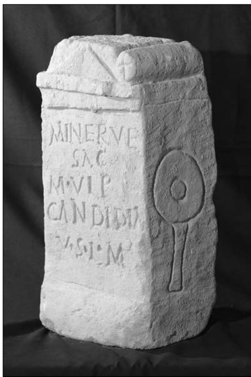
4. kép. A scarbantiai Minerva oltár