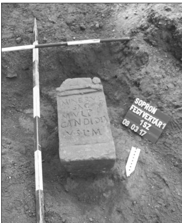
3. kép. A Minerva oltár feltárás közben, 2009

alakítottak ki a lehető legkevesebb munka befektetésével. Az oltártörzs felfelé enyhén keskenyedik, mérete: 32,3 cm × 27-28 cm × 18 cm. Bal oldalán egy 23 cm magas korszó ( urceus ), jobb oldalán egy 26 cm magas nyeles tál ( trulleum , táljának átmérője 13 cm) leegyszerűsített formáinak mély kontúrvonalait vészték (5. kép). Az oldalnézetből fülével együtt ábrázolt korszót az oltártörzs közepére pozícionálták, míg a nyeles tál ábrázolása lefelé eltolódott. Ennek oka, hogy a felülnézetből ábrázolt edény kerek tálrészét komponálták az oltártörzs jobb oldalának közepére, így az ezt követően kifaragott nyele, már elcsúszott és leért egészen a lábazat vonaláig. A kézmosásra használt edénypár reliefjei 9 a 2.–3. századi pannoniai oltárok oldalainak leggyakoribb díszítési témái közé tartoztak, 10 utalva a szakrális cselekedethez kötődő rituális tisztálkodásra.