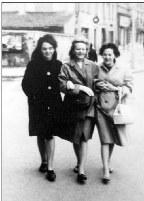
5. kép: Édesanyjával és féltestvérével Sopronban, 1965.