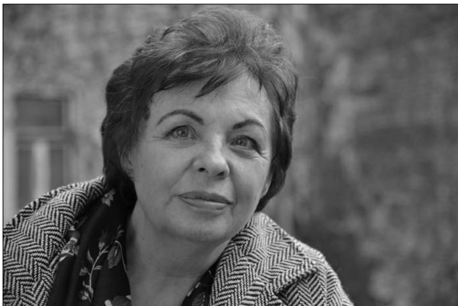
6. kép: Az író nő 2018-ban.