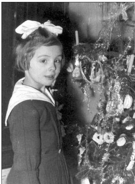
4. kép. Gyerekkori karácsony

Ahogy megírtad, idős néniket és bácsikat, öreg katonatisztek családjait, özvegyeit látogattátok, egy nagy múltú, de az új világban lecsúszott réteg képviselőit. Éles emlékeid maradtak fenn, gyerekként is érzékelted a helyzet fonák voltát.