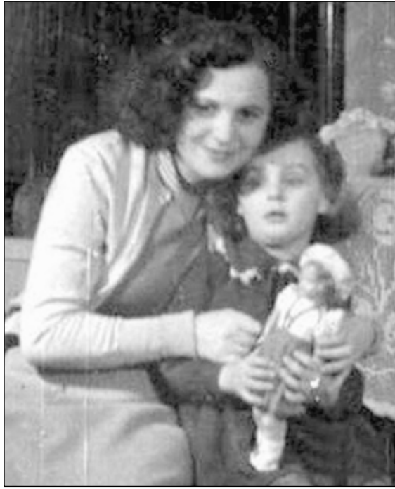
3. kép. Édesanyjával az 1950-es évek első felében.

méből, később bútorok, egyebek eladásából éltek, a venezuelai segítség is működött. Fehérvérúságban halt meg 58 évesen, 1952 januárban. Én 1950 decemberében születtem, alig múltam egy éves, amikor meghalt.