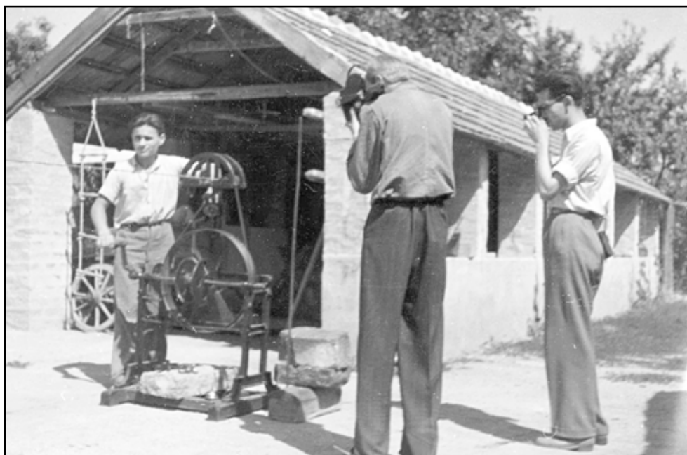
Köteles műhely filmezése K. Kovács Lászlóval. Keszthely, 1953.

tanára, a neves etnográfus, K. Kovács László (1908–2012) a műhely gyártástechnológiai folyamatait 16 mm-es filmen rögzítse. 12