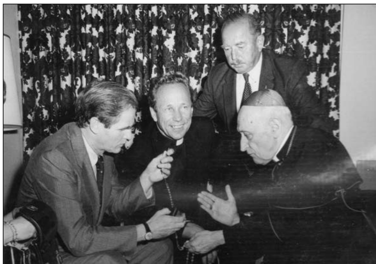
5. kép. Mindszenty József, Mészáros Tibor és Hajdu-Németh Lajos, 1973, New Brunswick, New Jersey

New York-i szervezetének és az általa alapított Magyar Amerikai Republikánus Szövetségnek. 1980-ban részt vett a Reagan-Bush republikánus párti jelöltek megválasztását támogató amerikai magyar országos szövetség munkájában. Somersetben (USA) hunyt el 1985. március 25-én.