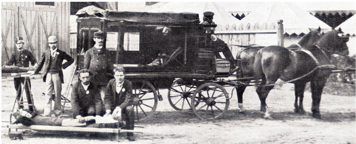
2. Landauer típusú oldalt nyitható betegszállító kocsi

A BÖME szolgálati és működési szabályzata ugyan tiltotta a fertőzőbetegek szállítását, de a fővárosban és környékén kibontakozó kolerajárvány esetében mégsem vonhatta ki magát a várható, tömeges méretű betegszállítások alól. 1892. július 21-én, a főváros tanácsához írott levelében az egyesület igazgatósága önként vállalta a kolerás betegek szállítását. A mentők a