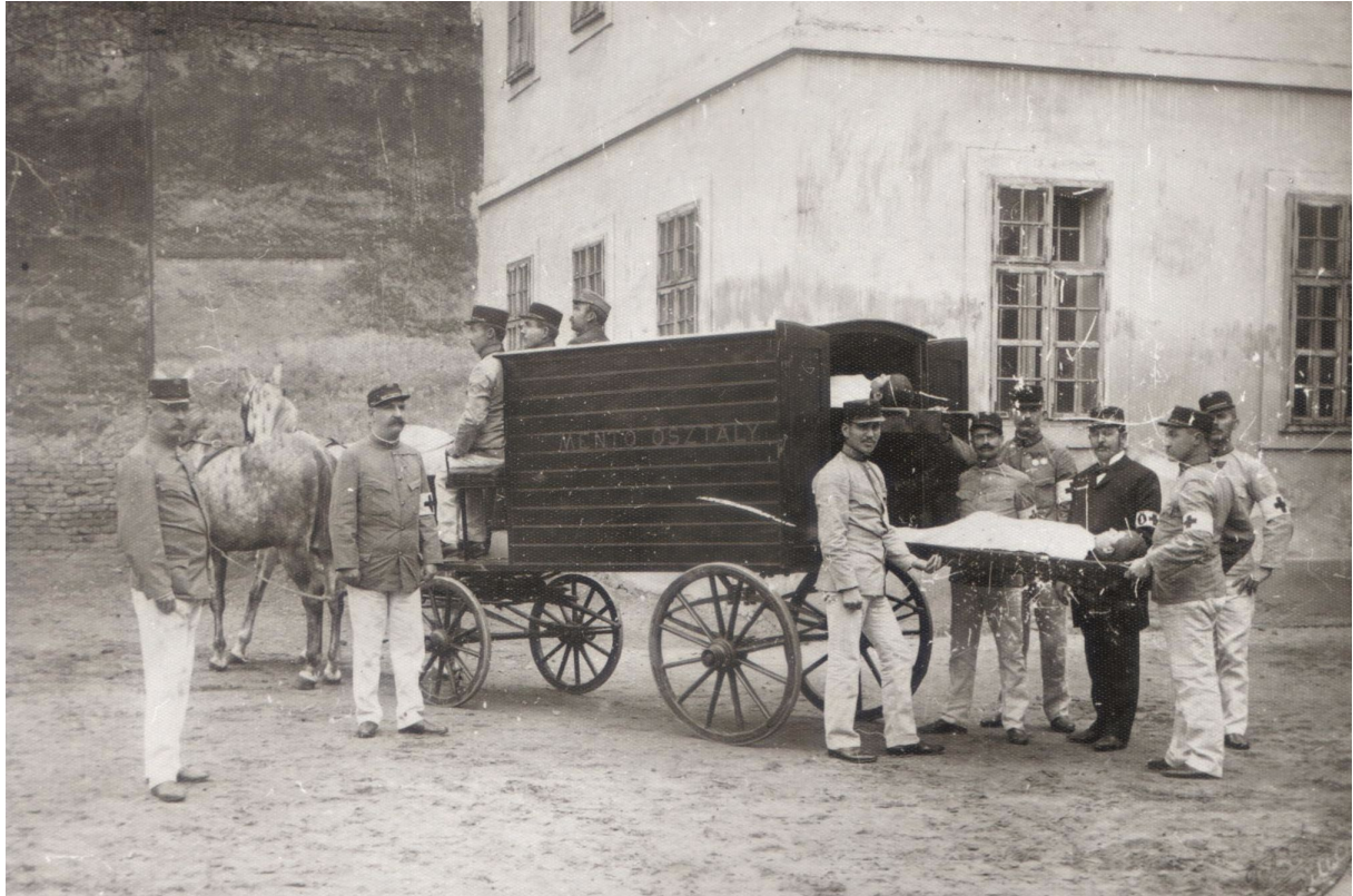
4-5. Szabadkai Önkéntes Tűzoltótestület Mentőosztálya halottszállítás közben

Ha kicsit késve is, de a 20. század első felére már Magyarország majd minden nagyobb városában a helyi tűzoltóság kötelékében szervezett mentőalosztály vagy attól függetlenül működő mentőegyesület alakult. A vidéki mentés centralizált formája végül 1926-ban, a Vármegyék és Városok Országos Mentő Egyesületének indulásával valósult meg. A mentők napi tevékenységük során a mentésen kívül a betegszállítások ismertetett formáival és esetenként helyi halottszállítással tettek eleget hivatásuknak.