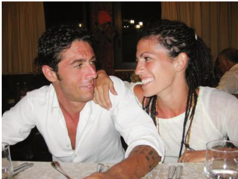
Fabo és barátnője a baleset előtt

A férfi 2014. júniusában szenvedett olyan súlyos autóbalesetet, amelynek következtében megvakult, és nyaktól lefelé teljesen megbénult. Légzése és táplálkozása gépekhez kötötté vált, bár beszélni még tudott, de csak rövid ideig, nagy nehézséggel. A szenvedélyes motoros, aktív és mozgalmas élettel bíró korábbi zenész egy speciális ágy és egy bénult test foglya lett, amelyből nem volt szabadulás.