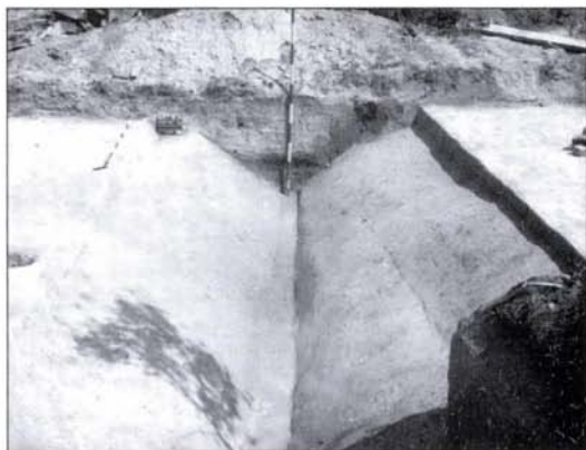
2. kép: A menettábor északi árokmetszete nyugatról (140. számú objektum)

Fig. 2: The cross-section of the northern ditch of the military fort from the west (feature no. 140)