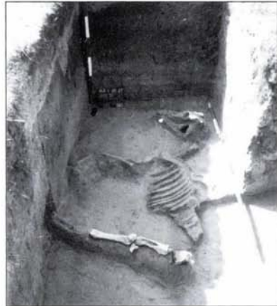
4. kép: Ló sírok maradványai (325. számú objektum)

Fig. 4: Remains of horse burials (feature no. 325)