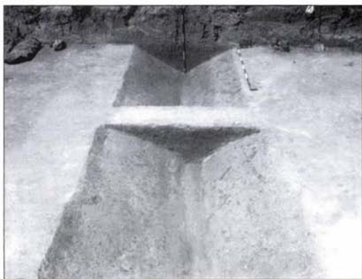
3. kép: A menettábor déli árokmetszete (357. számú objektum)

daltörredéke többszörös hornyolt dísszel, vastagabb és vékonyabb falú nyersszínű oldaltörredékek, valamint Gabler D. szerint egy rheinz-