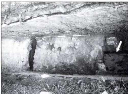
6. kép: Az erődfal és a mellette levő észak-déli bástyafal északról

tion and the underlying 50–60 cm thick earthy pebble layer, which was the remains of the foundation of an originally paved road, were discovered in the section of the test trench, 2.5 m east of the end wall of the bastion, on a 1.5 m wide