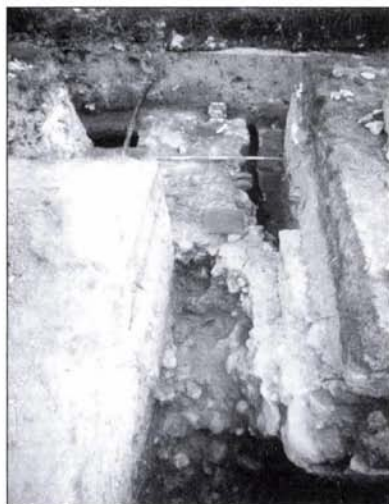
5. kép: Az erőd falon levő padlómaradvány, előtérben a bástya felmenő falának részlete északról

Fig. 5: The floor remains on the fort wall with a detail of the vertical wall of the bastion in the foreground, viewed from the north