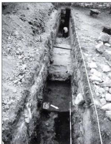
4. kép: A kelet–nyugati kutatóárok, előtérben a bástya sárga agyagba rakott fala keletről Fig. 4: The east–west oriented test trench with the wall of the bastion in yellow clay in the foreground, viewed from the east

pozásra ácsolják, majd a favázak közeit agyag téglákkal kifalazzák. A feltárt, napvilágra került jelenségek egy ilyen szerkezetű erődfal maradványáról tanúskodnak.