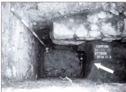
7. kép: A bástya északnyugati sarka nyugatról

We found a recent, very regular, east-west oriented pit with vertical walls on the northern side of the bastion, which extended to the northwestern corner of the bastion, the wall of the fort and probably also the northeastern corner