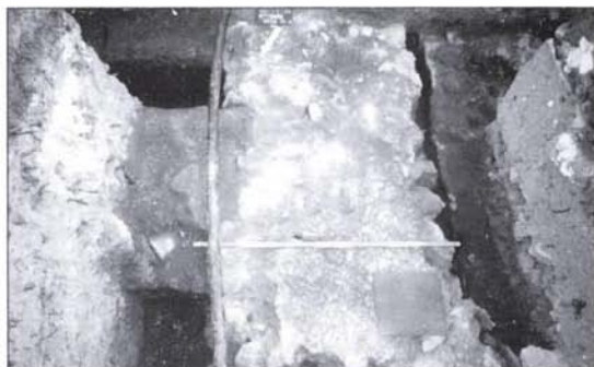
2. kép: Az észak-déli irányú erődfal habarcsos teteje északról Fig. 2: The mortared top of the north-south oriented wall from the north

Feltűnő volt az, hogy a táborfal teteje, a hozzáépített bástya belső járószintjével egy magasságban maradt fenn. (5. kép) Az erődfal habarcsos teteje síma volt, a habarcsban kváderkő lenyomatát nem észleltük. Közvetlenül a fal habarcsos felszínére húzódott rá a bástya belső padlószintje. Ez a megfigyelés két következtetés levonására ad lehetőséget: