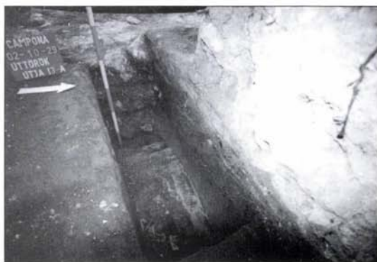
3. kép: Az erődfal alapozásának falszöveve keletről Fig. 3: The foundation wall of the fort wall from the east

The first conclusion suggests that the sources (Zosimus II. 21.,