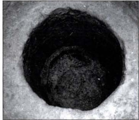
2. kép: A római kút a famaradványokkal Fig. 1: Roman well with wooden remains

A római kori topográfia szerint a telek az 1. századi római tábor feltételezett területétől északra helyezkedik el. Az ásási területen két bizonytalan rendeltetésű köves felület kivételével római kori járószintet nem tudtunk megfigyelni. Kőfal alapozása csak egy helyen került elő, a