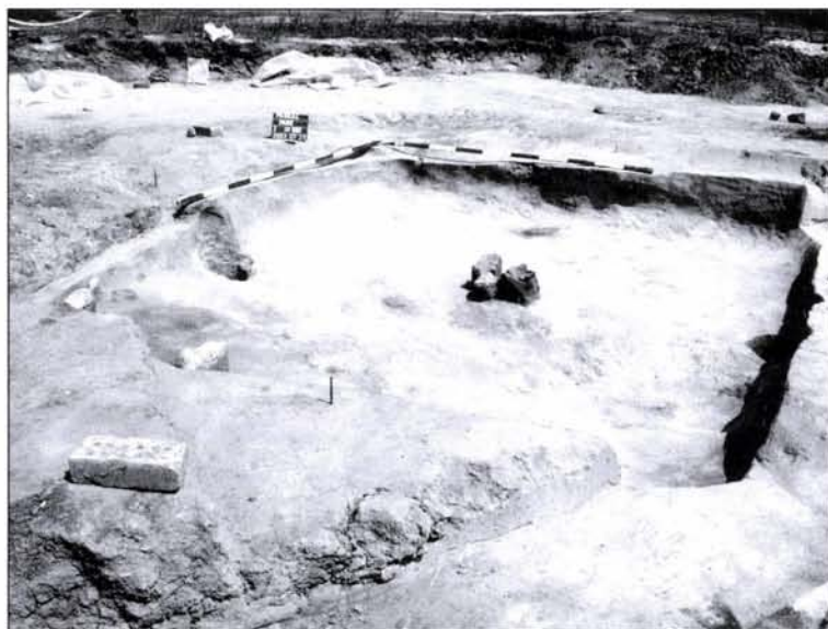
2. kép: Szarmata ház Fig. 2: Sarmatian house

fülbevaló melléklettel. (1. kép) A terület igen nagymértékben újkori beásásokkal bolygatott. A „G” szelvényben bizonytalan korú, de betöltésük alapján régészeti jellegű (valószínűleg szarmata), egymást keresztező árok kerültek elő. A „J” szelvényben legújabb kori szemetes feltöltés és egy észak–déli irányú, újkori árok és hasonló korú gödrök mellett egy félig földbe mélyített szarmata kori ház (2. kép) és egy gödör kerültek elő. A ház négyzet alakú, északi sarkában kővel kirakott tüzelőhely volt. északkelet–délnyugati tengelyében három cölöplyukkal. Padlója nem volt, bejáratát sem sikerült megtalálnunk.