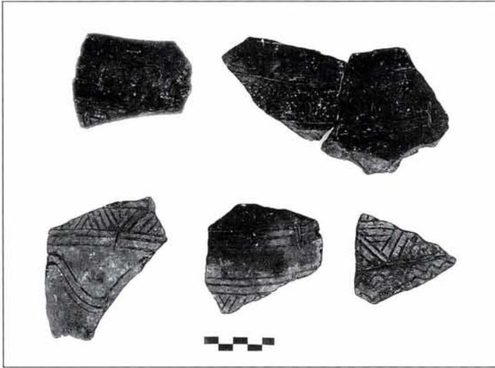
2. kép: Bekarcolt díszű kerámia töredékek Fig. 2: Incised decorated ceramic vessels

Az ásás során több különleges tartalmú gödröt is találtunk, amelyek leleteik (egész edények, állatsontok, kőeszközök) alapján az őskori kultusszal állhatnak összefüggésben. Ezek között mind a kottafejes, mind a zselízi korszakhoz tartozóak is voltak.