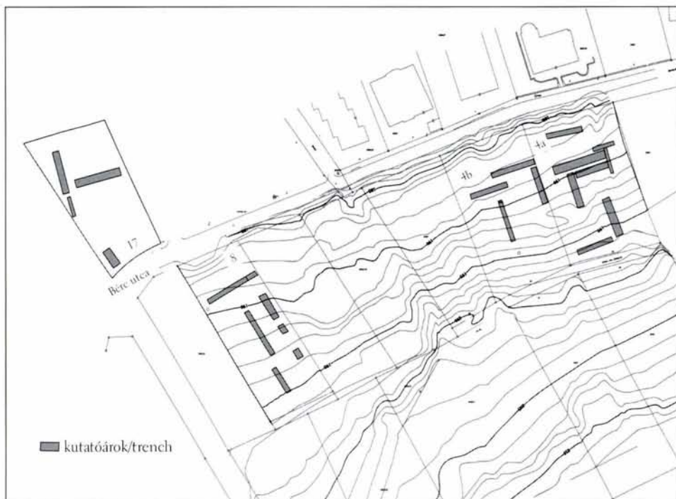
2. kép: Budapest, I. ker.; a Bérc utcai feltárások helyszínrajza. Fig. 2: Budapest I: Map of the excavation on Bérc Street

5338/3–4 hrsz. beépítetlen telkeken a felszínen is gyűjthetők kelta edénytöredékek. A Bérc utca 8. számú telekkel nagyjából szemközt, a Bérc utca északi oldalán lévő 17. számú telken (2. kép) szintén módunk volt próbaásatást végezni, amelynek eredménye ugyancsak azt mutatja, hogy sem a késő bronzkori, sem a késő La Tène kori település nem folytatódik észak felé, a Tabán irányában ezen a szakaszon.