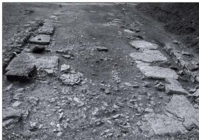
3. kép: Az újra letisztított „G” utca vonala nyugat felől

által integrálható a romkert déli részének látogatható és látható emlékei közé. Figyelemmel kísértük a kiállítási (volt ELMŰ) épület északi és nyugati oldalán meglévő nyomvonalon újra kiásott kábelárkot is. Ebben régészeti lelet, vagy objektum nem mutatkozott, akárcsak a járda nyomvonalát kísérő kerítésoszlop-alapokban sem.