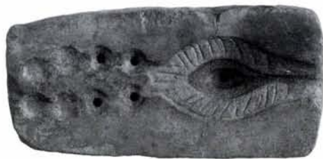
9. kép: Ovális, vésett díszű elemből és lánéból álló, egybeöntött ékszer öntőmintája

A kora császárkori gödörobjektumok betöltéséből kézzelformált La Tène ha-