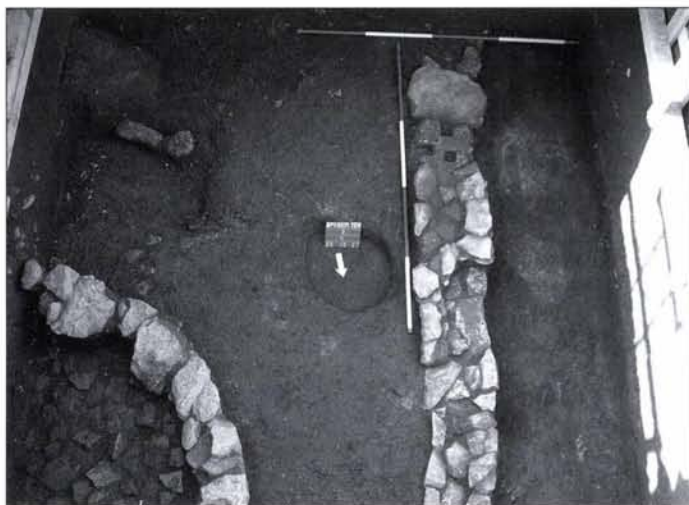
8. kép: Az 5. számú kutatóárokban feltárt apszis és észak–déli falalapozás részletei

A szondázó ásátás során, az 1. kutatóárok kivételével, már a török hódoltság kori, ill. a középkori rétegekben is találtunk szórvány, római kori kerámiát, üveg-szilánkokat, esonteszközöket (hajtút), bronztüredékeket. Kisebb, kövezett aljú, déli záródású apszis részlete került elő az 5. kutatóárok északkeleti sarkában. Ennek Kr. u. 3. századi pusztulási horizontja alatt észak–déli, ( opus incertum ) falsonk jelent meg az árok nyugati felében, faragott kűszöbkövel és nyugati oldalán vastag átégett, patiosos omladékréteggel (8. kép). Hasonló, észak–déli irányú alapozás, ill. északnyugati falsarok maradványait figyelhettük meg a 3. kutatóárokban, valamint kelet–nyugati irányú, erősen megsüllyedt falsonk jelent meg a 2. szonda délnyugati sarkában. Utóbbi rétegtani helyzetét és feltárt állapotát az alatta lévő 2. századi, laza, faszenes betöltésű, több mint 2 m mély hulladékgödör határozta meg. A falsonk keleti szakaszát az alapárok aljáig kisedték, később az alapárok déli széle alatt, La Tène D (1-2?) hulladékgödöröt bontottunk ki. További, Kr. u. 1-2. századi hulladékgödöröket és cölöplyukakat tártunk