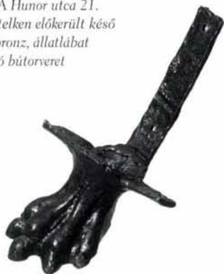
4. kép: A Hunor utca 21. számú telken előkerült késő római bronz, állatlábat mintázó bútorveret

egységes kitzúzési koncepció. A kora római épületek díszítésére a feltöltésből előkerült vakolatföredékek utaltak. A vakolatok gyenge megtartása miatt a festett részek szinte teljesen lekoptak a töredékekről. Az épületek pusztulását követő tereprendezéssel erősen megemelkedett a terepszint.