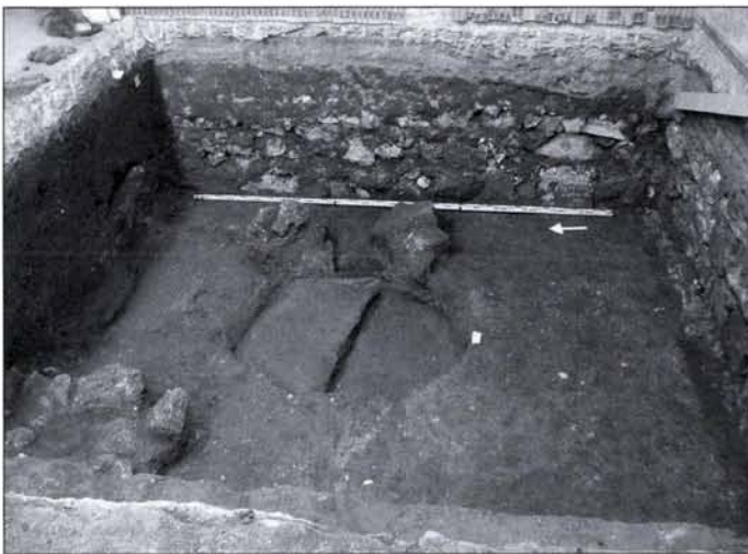
7. kép: A 2. számú kutatóárokban feltárt középkori kemencék

Az ásatási terület szűkebb és tágabb környezetét érintő adatok a római kori topográfia tekintetében jelentősen gyarapodtak az elmúlt évtizedekben (KÉRDŐ 2002, legutóbb: BENDA–HABLE 2006).