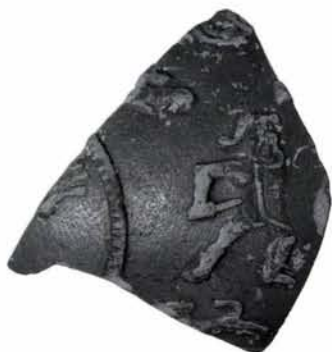
6. kép: Gladiátort ábrázoló terra sigillata edény töredéke

kötöredékek más-más helyiség díszítésére utalnak, melyek funkcióira talán épp a töredékek összeállítását követően kaphatunk majd választ. A jobb állapotban megmaradt falfestmények masszív alapozással rendelkező falak mentén kerültek elő, ezért kevésbé valószínű, hogy csak közfalak lettek volna, ahogy azt korábban a Vályog utca 13. számú telek feltárásánál feltételezték (MADARASSY 1997, 51). Az épületek komfortját a később átépített terrazzóval kikent aljú csatorna biztosította, ennek csak egy kisebb szakasza maradt meg. A telek délnyugati negyedében épület, épületalpozás nem került elő, talán belső kert vagy udvar lehetett ezen a területen. Az itt feltárt feltöltési rétegből származik a 6 képen látható Kr. u. 2. sz. vége – 3. sz. elejére keltezhető terra sigillata töredék is.