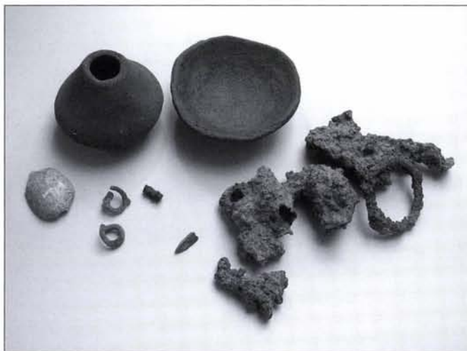
2. kép: Vaskori (szkíta kori) hamvasztásos sír mellékletei

hajkarikák, korrodálódott vastárgy (nagy valószínűséggel zabla) ép és töredékes kerámiaedények kerültek elő. A sírból előkerült jellegzetes leletanyag: tálka, kettősűpös edényke, tekereses bronzfüggők (PATAY 1955, 66 és XIV.t.1-36, Abb. 3.5. és 4.2.) háromélű bronz nyílhegy (KEMENCZEI 1986, 118, 122) gyöngyök (PATAY 1955, 63 és XII.t. 5) és zabla(?) alapján a sírok a szkíta korra keltezhetők (2. kép). (A sírok meghatározásánál Maráz Borbála segített, munkáját ezúton is köszönöm.)