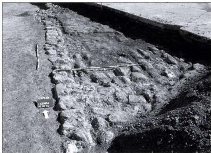
10. kép: Kövezett, észak–déli irányú római út feltárás közben

A 2008-ban a létesítményhez csatlakozó út építését megelőző ásatáson feltárt Kr. e. III. évezred végéről és a II. évezred első feléből származó, kora bronzkori településjelenségek is különböző korú, sokszor régészeti leleteket is tartalmazó, áradásos rétegek alól kerültek elő. A korszak itt megtelepedett népcsoportjainak (Haragedény kultúra-Csepel csoport, és a Nagyrév kultúra) települései általában a parthoz közeli részeken alakultak ki, melyeket a Duna ismétlődő áradásai gyakran elöntöttek. Cölöpvázas házak nyomát megőrző földbe mélyített cölöpgödörök itt, a telep és a hozzá tartozó hulladék vagy tároló gödörök gyakori megújítása miatt csak ritkán kerültek elő. Meglétüket azonban részben a területen szétmosódott, ill. planírozási gödörökbe eltemetett tapasztásmaradványok is igazolják.