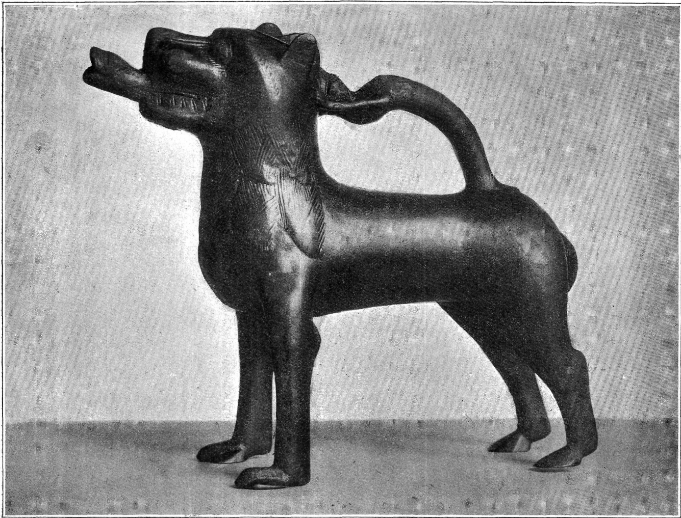
1. kép. Aquamanile a Fővárosi Múzeumban.