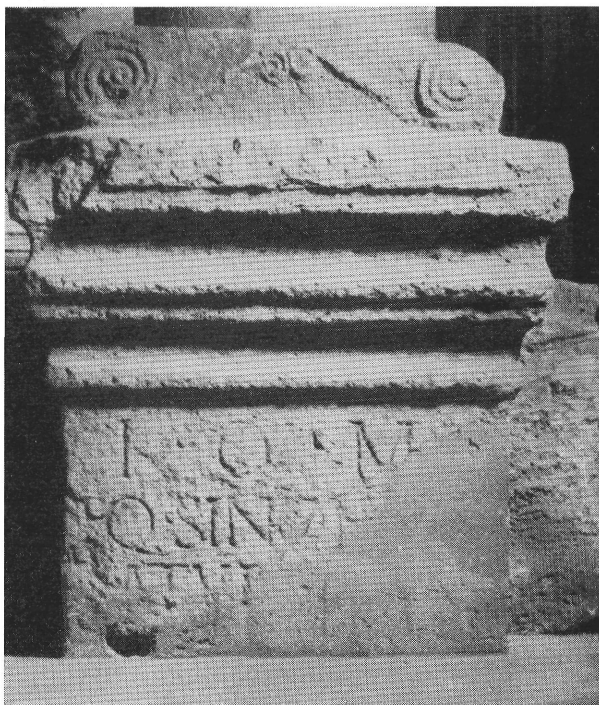
2. kép. Haterius Saturninus testőrlovasainak oltárköve. Budapest — Palotaújfalu

Attius Macro helytartóságának időpontjára vonatkozólag — és arra, hogy melyik pannóniai tartományt igazgatta — azonban az aquincumi kőemlék lelőhelyénél is többet mond az oltárkö felirata, amelynek utolsó sorában Attius Macro mint consul designatus szerepel. Ismerve mármost Attius Macro consulság ának időpontját (i.sz. 134) szem előtt tartva azt is, hogy a consuli hivatalra jelölés az akkori idők gyakorlata szerint általában a hivatalbalépést megelőző év második felében történt, 37 Attius Macro aquincumi oltárát egészen pontosan a 133. év második felére keltezhettük.