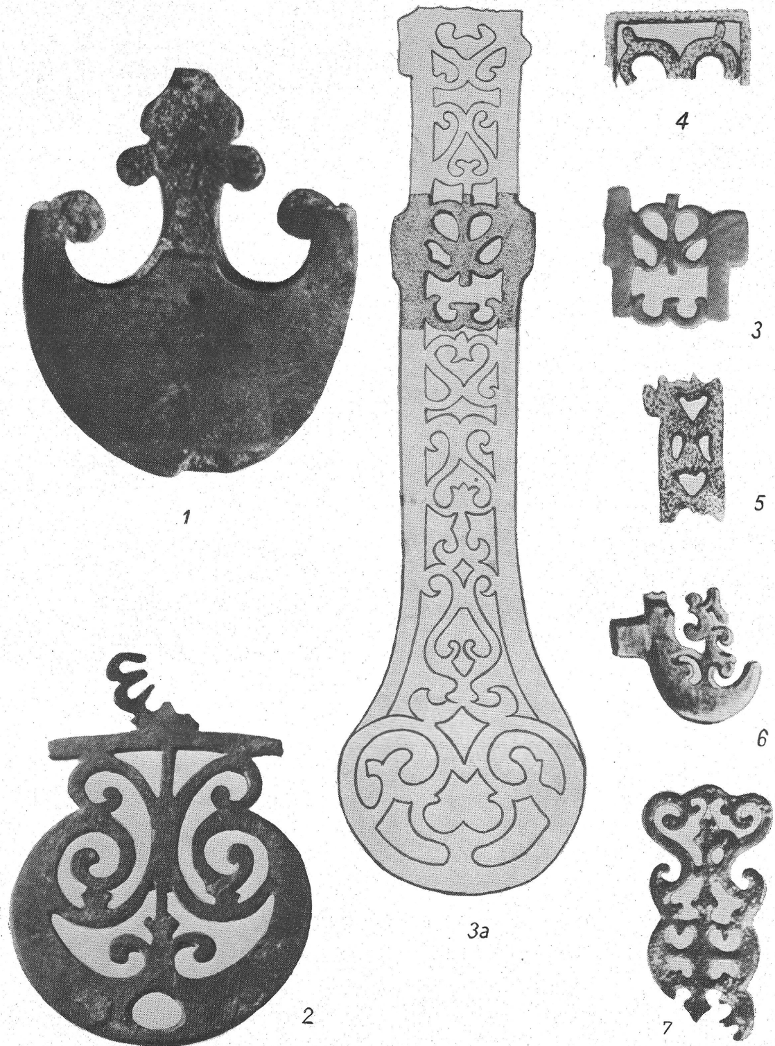
III. tábla. 1 = Aquincum (?) törhüvely alsó verete. Magángyűjteményben. Méret 1 : 1. 2 = Ismeretlen pannoniail lelőhelyről, törhüvelyborítás (?) verete. Magyar Nemzeti Múzeum. Méret 1 : 1. 3 = Aquincum, törhüvelyborítás töredéke. Aquincumi Múzeum. Méret 1 : 1. 3a = Faimingeni törhüvelyborítás rajza; a sötétebb részbe 3. számú aquincumi töredék beleszerkesztve. Méret 1 : 1. 4 = Aquincum, törhüvely (?) veret töredéke. Aquincumi Múzeum. Méret 1 : 1. 5 = Dunaújváros—Intercisa, törhüvely (?) veret töredéke, Magyar Nemzeti Múzeum. Méret 1 : 2. 6 = Napoca-Cluj, Dácia (Románia). Törhüvelyveret töredéke (Cluj, Múzeum. Méret 1 : 1). 7 = Óbuda, Raktár utcai Cella trichora, törmarkolatveret töredéke. Aquincumi Múzeum. Méret 1 : 1.

1 = Aquincum (?), unterer Beschlag einer Dolchscheide. In einer Privatsammlung. Maß 1 : 1. 2 = Von unbekanntem pannonischem Fundort, Beschlag eines Dolchscheidenbeschlages (?). Ung. Nationalmuseum. Maß 1 : 1. 3 = Aquincum, Fragment eines Dolchscheidenüberzuges. Museum von Aquincum. Maß 1 : 1. 3a = Zeichnung eines Dolchscheidenüberzuges von Faimingen; in dem dunkleren Teil mit dem eingezeichneten Aquincumer Fragment Nr. 4. Maß 1 : 1. 4 = Aquincum, Beschlagfragment einer Dolchscheide (?). Museum von Aquincum. Maß 1 : 1. 5 = Dunaújváros-Intercisa, Fragment eines Dolchscheidenbeschlages (?). Ung. Nationalmuseum. Maß 1 : 2. 6 = Napoca-Cluj, Dazien (Rumänien). Fragment eines Dolchscheidenbeschlages. (Cluj, Museum. Maß 1 : 1). 7 = Óbuda, Raktár-Gasse, Cella trichora, Fragment eines Dolchgriffbeschlages. Museum von Aquincum. Maß 1 : 1.