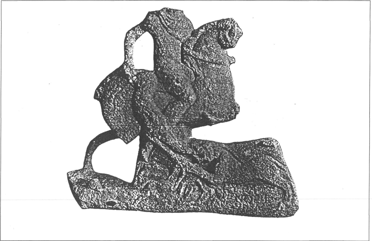
Abb. 5. Statuette des sog. "thrakischen Reitergottes" mit einem erlegten Jagdtier (nach KAZAROW 1938. Taf. XV. Abb. 90)