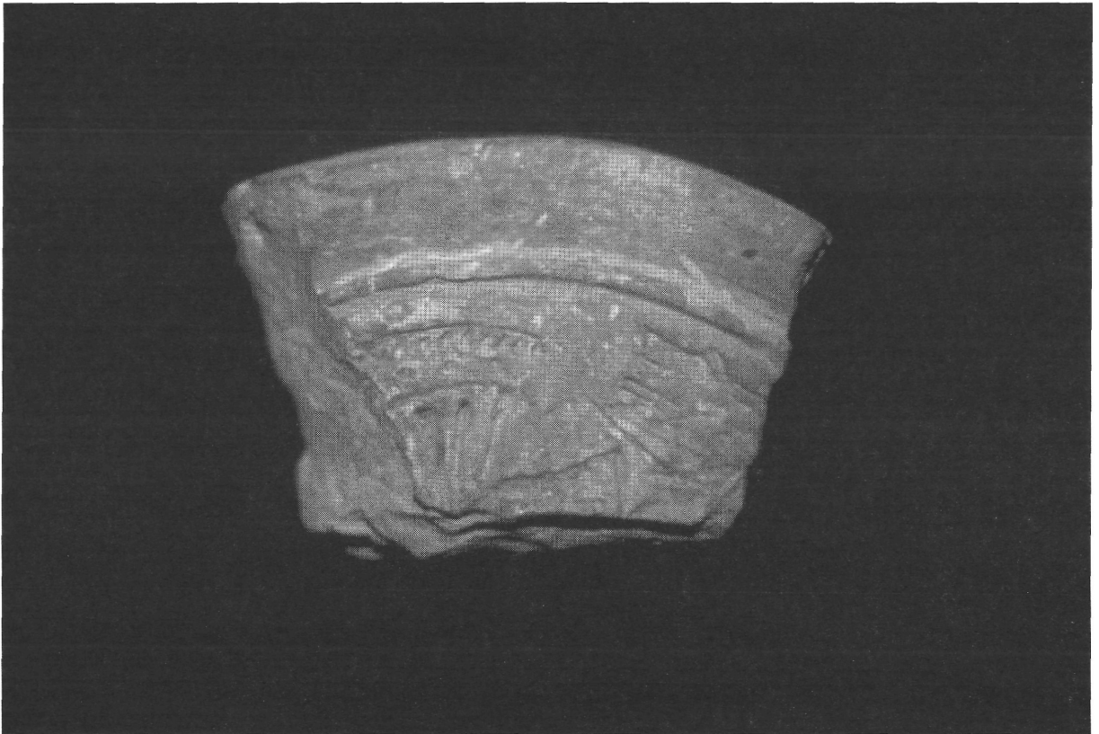
Abb.8. Fragment des Reliefmedaillons aus der Bäckerei von Brigetio (FO: Szöny-Vásártér). Inv.: 998.-B16.011.20.