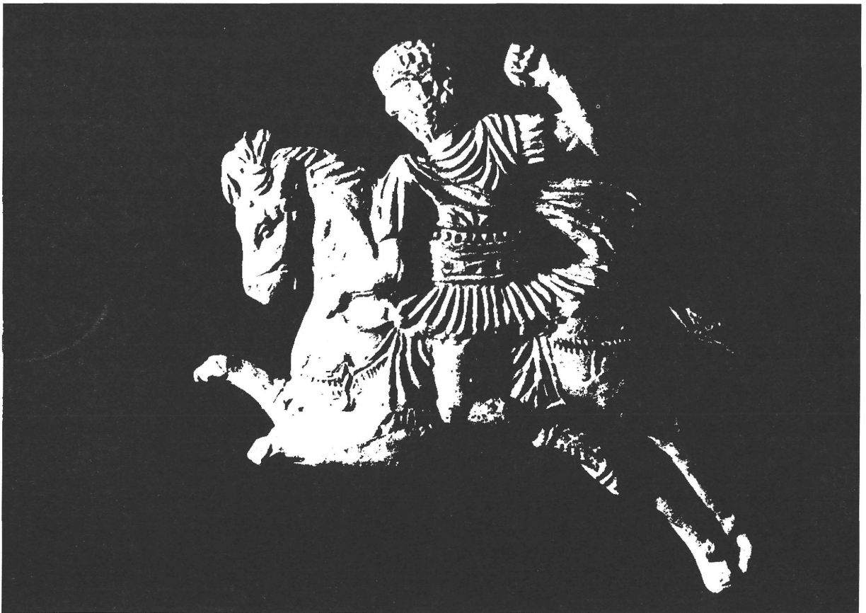
Abb.6. Tonfigur eines römischen Kaisers (Mark Aurel?) zu Pferde aus Aquincum (nach PÓCZY 1986. 43., Abb. 12)