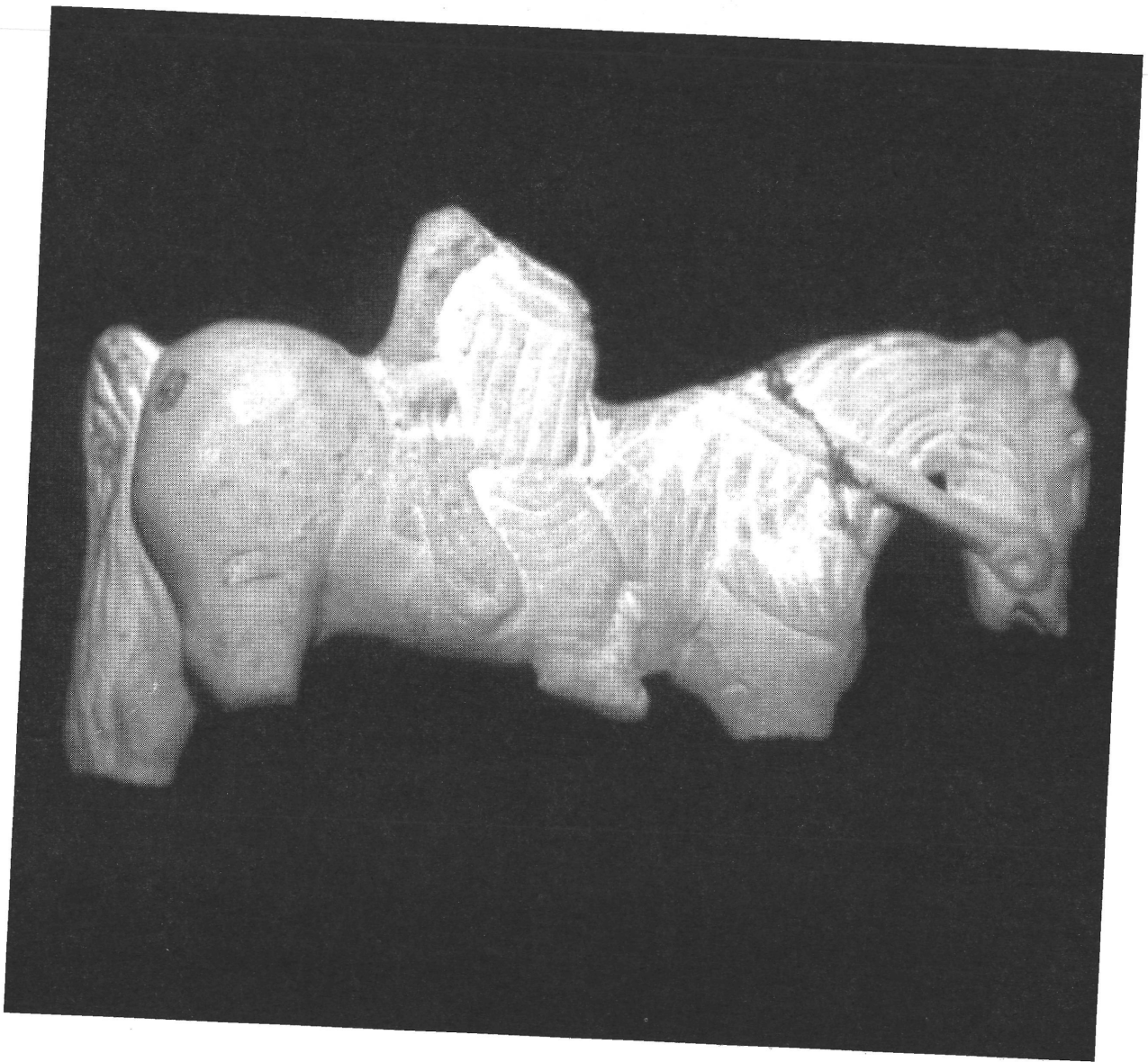
Abb. 2. Photo der Statuette in Hauptansicht