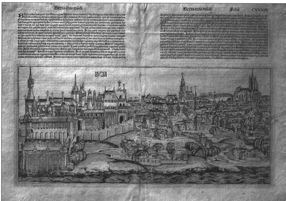
3. kép. Buda látképe Hartmann Schedel Világkrónikájában, Nürnberg 1493.