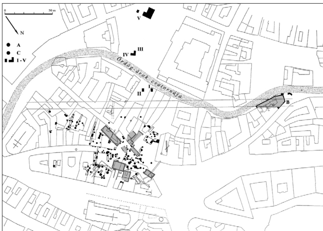
2. kép. A Budapest–tabáni ásások (1934–1950) helyszínrajza. A: késő La Tène-kori objektumok és feltárási szelvények; B: az Órdög-árok középkori támfala és hídpillére; C: egyéb régészeti objektumok; I–V: az 1950. évi ásások szelvényei.