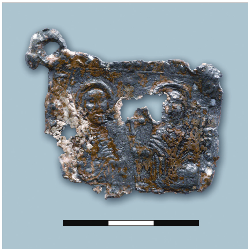
1. kép. Szent Péter és Pál apostolokat ábrázoló zarándokjelvény az Árpád-kori Kána faluból Fig. 1. Pilgrim badge from the Arpad age Kána village with depiction of St. Peter and Paul