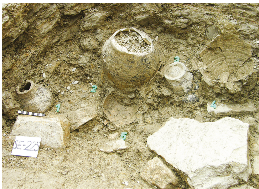
1. kép – Késő Árpád-kori, sziklába vájt gödör feltárás közben az Ifjúsági Park területén. Image 1 – Excavation of a late Árpádian-age pit carved into the rock in the Youth Park., (fotó: Terei György / photo by György Terei)

A lokalizálással kapcsolatban sokáig nem rendelkezünk komolyabb régészeti bizonyítékkal. 2008–2009-ben a budai főgyűjtőcsatornához kapcsolódó régészeti munkálatok során Papp Adrienn a Dunához közel, az Apród utca – Döbrentei utca – Lánchíd utca kereszteződésében kijelölt