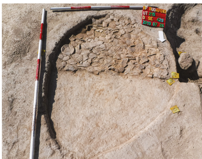
6. kép – Kerámiatöredékekkel letapasztott tüzelőfelület a feltételezhető Kocsola falu területéről. / Image 6 – A hearth scattered with pottery fragments from the area of the presumed Kocsola village.

A Naprét utcai lakóházat pincével építették. A megfigyelt több mint 200 m 2 -en egy kisebb gödör került elő néhány darab jellegtelen középkori kerámiatöredékekkel. Ekkor úgy gondoltuk, hogy megtaláltuk az egykori Kocsola falut, hiszen nagyságrendileg erre a területre lokalizáltuk a te-