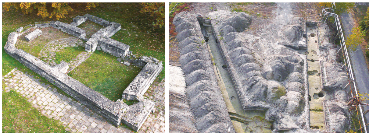
8. kép – Drónfelvétel Csót falu helyreállított templomáról. (balra) / Image 8 – Drone photo of the restored church of the former village of Csót., (left)