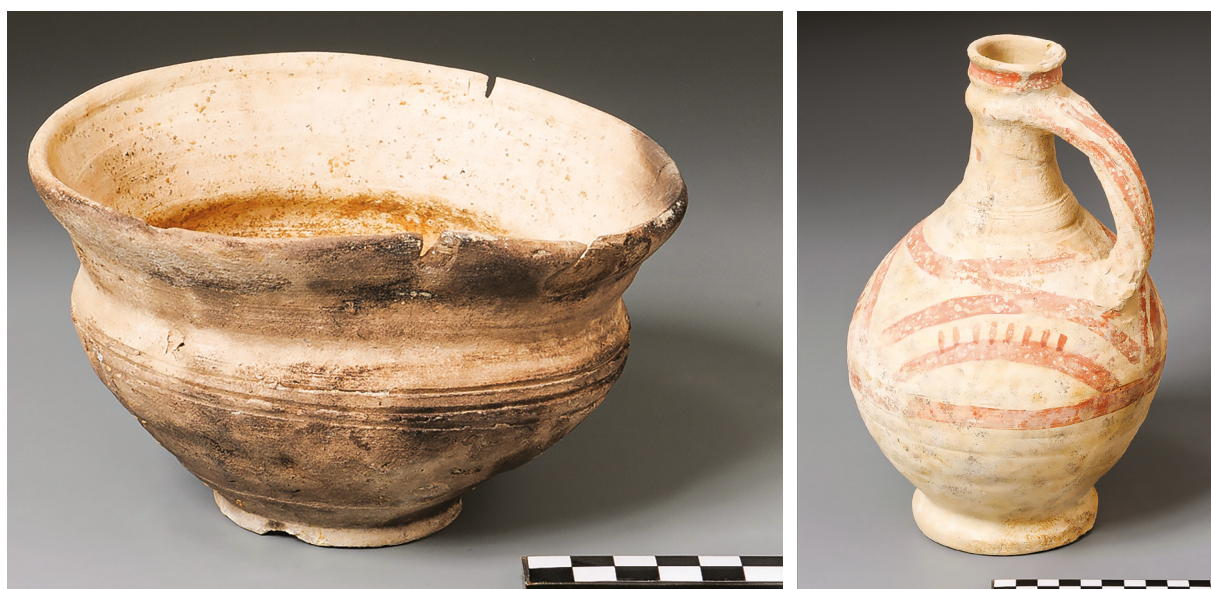
2. kép – Kis fazék (csésze) Kisebb Pest területéről. / Image 2 – A small pot (cup) from Kisebb Pest.