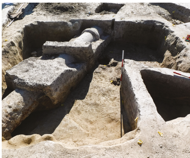
7. kép – Földbe mélyített középkori objektum a feltételezhető Kocsola falu területéről. / Image 7 – Semi-underground medieval feature from the area of the presumed Kocsola village.