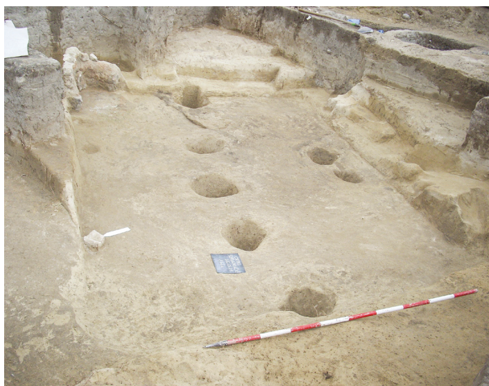
13. kép – Földbe mélyített, több oszlophellyel rendelkező Árpád-kori ház Csepel-Szabadkikötőben, 2008.

Image 13 – Árpadian-age house with several column bases in Csepel-Szabadkikötő, 2008.