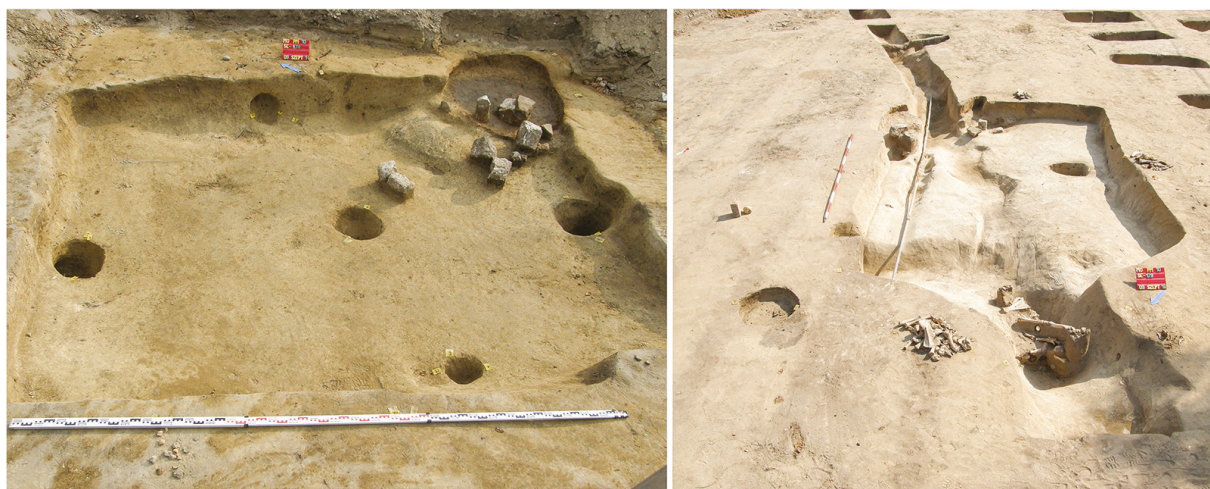
15. kép – Földbe mélyített Árpád-kori házak Szigetszentmiklós – Dunára dűlő területén. / Image 15 – Árpadian-age pit houses in the area of Szigetszentmiklós – Dunára dűlő.