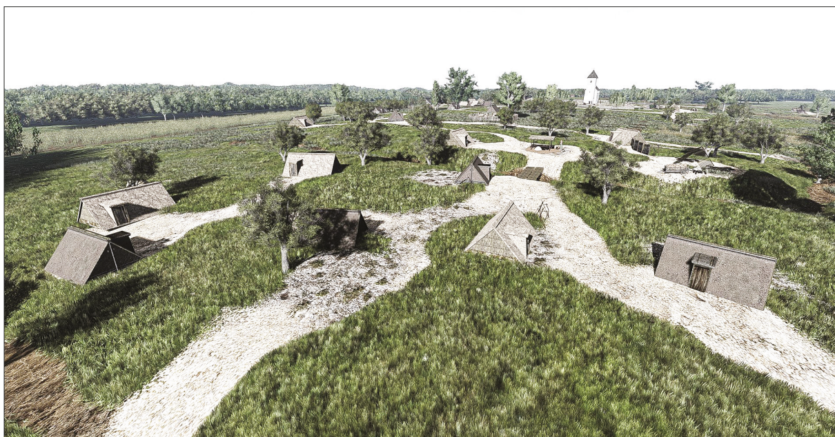
5. kép – Rekonstrukciós kép Kána faluról a feltárások eredményei alapján. / Image 5 – Reconstruction image of the village of Kána based on the excavation results. (Fodor Zsolt, Iceteam Design Kft. / Zsolt Fodor, Iceteam Design Ltd.)

2003 és 2005 között nemcsak dél-budai, hanem országos viszonylatban is az egyik legjelentősebb Árpád-kori falufeltárás történt. A 15-16 hektár nagyságú 12-13. századi településen egy két periódusban épült templomot, körülötte egy 1067 síros temetőt, 198 földbe mélyített házat, valamint négy tárolóhelyiséget tártunk fel. Nemcsak a számadatok, hanem a gazdag leletanyag teszi a lelőhelyet az eddig feltárt legnagyobb Árpád-kori falunkká. A nagyszámú kerámiatöredék mellett, gazdag vasanyaggal rendelkezik; az Árpád-kori falvakhoz képest nagyon sok üvegtöredéket, fegyvert és viseleti tárgyat is találtunk. 23 Az egykori Kána falu területén folyt régészeti kutató-