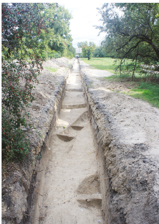
10. kép – A Furnérművek előtt húzott csatornaárok feltárása. / Image 10 – Excavating the canal trench in front of the Veneer Works.

A Nagytétényi út 274-276. szám alatt a Kulturális központ építését megelőző régészeti feltárás során agyaggal tapasztott, mészkövekből rakott keskenyebb falú épületek részletei kerültek elő. Feltehetően korábbi periódushoz tartoztak azok a középkori épületek, amelyeknek oszlophelyeit sikerült feltárni. A gyakori tűzvészek nyomait (pusztulási rétegek formájában) ugyancsak megfigyelhettük. Már az Árpád-kor utáni időszakból származik az a nagyobb, félig földbe mélyített veremház, amelynek felmenő falai agyagba rakott kőből készültek, belőle vassarló, vas övcsat és piros festésű középkori kerámia került elő. 39 A Nagytétényi út 306. szám alatt álló, úgynevezett „Szelmann ház” területén történt kutatások során először 16-17. századi rétegek, majd lejjebb ha-