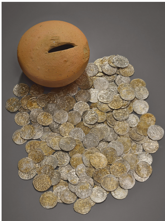
3. kép – A leletegyüttes / Image no. 3 – The assemblage

A magyar pénzermék korrendjének kialakításánál Kálnoki-Gyöngyössy Márton 2003-ban publikált doktori disszertációja, 13 Huszár Lajos 14 és Pohl Artúr korai művei, 15 illetve V. Székely