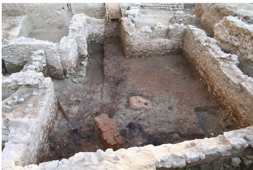
1. kép – A középkori ház padlószintje déli irányból / Image no. 1 – The floor level of the medieval house viewed from the south

A Budai Irgalmasrendi Kórház II. kerület Frankel Leó út 17-19. szám alatti kórházudvarán 2019 májusa és októbere között a Budapesti Történeti Múzeum régész munkatársai nagy felületű feltárást végeztek a Be-