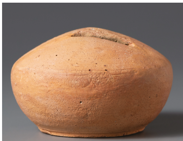
2. kép – A cseréppersely Image no. 2 – The ceramic money box

szürke faszenes agyagréteg, mely a ház egykori padlószintje lehetett. (1. kép) A középkori ház keleti falának belső oldala mellett a padlószinten 2019. október 14-én egy vörösre égett ép kerámiapersely került elő, amely tele volt érmeikkel.