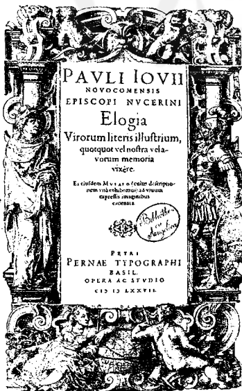
Fig. 1 – P. Giovio, frontespizio, Elogia virorum illustrium , Basilea, 1577

parte della raccolta, non è difficile coglierne l'intenzione o l'impronta per così dire autobiografica: i personaggi effigiati appartengono tutti al medesimo ambiente di cui Sambucus faceva parte, cioè alla cerchia degli umanisti e antiquari, grecisti e latinisti, che avevano riscoperto i grandi medici e scienziati del mondo antico e ne avevano curato edizioni critiche, filologicamente basate sui manoscritti originali. Alcuni di quei personaggi erano stati i primi tutori e docenti di Sambucus, e rispecchiavano il mondo delle università che lo stesso Sambucus aveva conosciuto in gioventù.