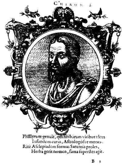
Fig. 15 – J. Sambucus, Chiron, Icones , Anwerp, 1574