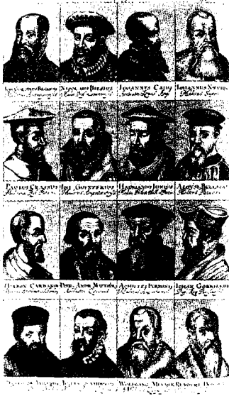
Fig. 19 – P. Freher, Sambucus, Theatrum virorum illustrium , Norimberga, 1680