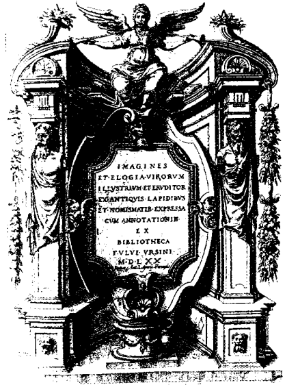
Fig. 8 - F. Orsini, Imagines et Elogia virorum illustrium , Roma, 1570