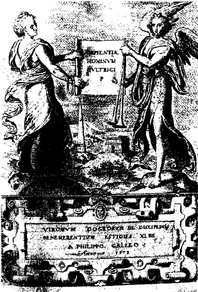
Fig. 7 - . P. Galle, frontespizio, Virorum doctorum , Antwerp, 1572