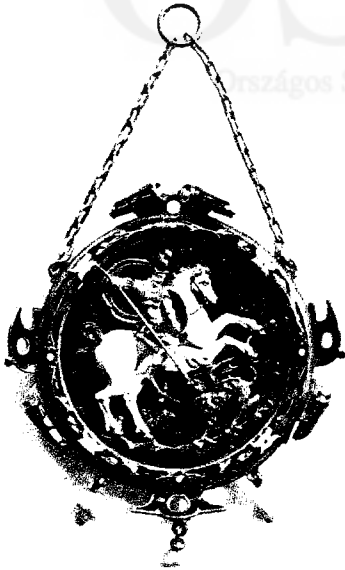
Fig. 17 – Gioiello di manifattura francese del sec. XVI con San Giorgio e il Drago