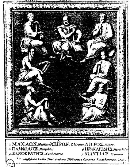
Fig. 16 – G. P. Bellori, Dioscoride di Vienna