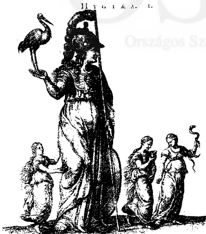
Fig. 12 – Sambucus, cornice, Icones , Anwerp, 1574

Tu serpens, & fœnis noster, tantumque laborum Adtis, auspicio formula sana veni. Edito quod rarum est, thetauro: prome benignos, Thurcificans grana, decusque feras.