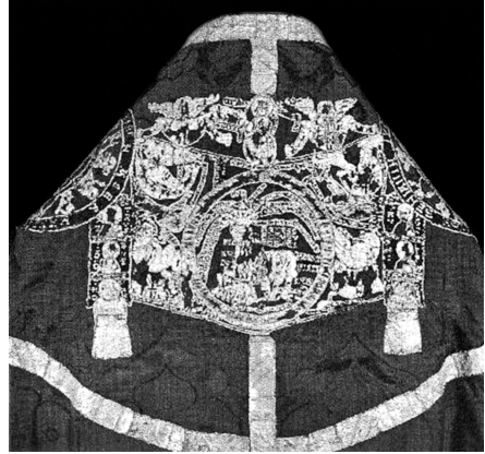
Fig. 2. Parte posteriore del razionale di Bamberg (K. Honselmann, Das Rationale , cit., fig. 2)