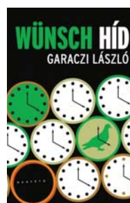
Garaczi László: Wunsch híd Magvető kiadó, 2015 160 oldal

„Van egy titokzatos híd a Városligetben a Hősök tere és a tó között. Erre járt a földalatti, a síneket betemették, néhány méternyi földön ível át a gyaloghíd. Céltalan kerülő az ég felé, emléke a nincsnek. Garaczi László mára már klasszikus lemur-sorozatának újabb emlékezetes része erre jár” – olvasható a könyv fülszövegében. „Az elbeszélői hang egyszerre naivan gyermeki és a vénnél is vénebb; a folyamatos múlt intenzív jelenléte alakítja-tagolja ezeket a kispróza meseterfutamokat. A regény apró elemekből épül fel és az egész árnyéka a hiányt rajzolja ki. Garaczi közelről pillant az emlékezet és a felejtés tárgyra, megfigyeli a múltat, leírásai az érzéseinkre hatnak. Ennek az írásművészetnek ízei vannak, mégsem hangulatpróza.” T. E.