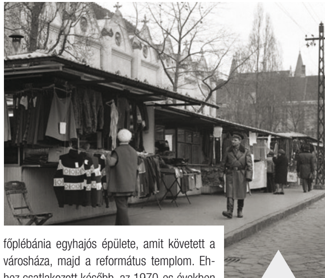
Az Újpesti Piac a 1970-es években

Mert ilyen szempontból talán nem a legszerencsésebb főtér az újpesti, az ország főterei közül. Hogy miként alakult a jelenlegi állapota szerint, azt meghatározta a római katolikus