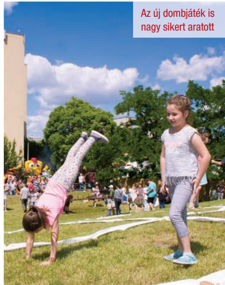
Az új dombjáték is nagy sikert aratott