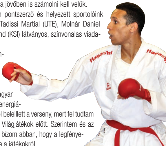
Az oldalt összeállította: GERGELY GÁBOR

– Fontos verseny volt, hiszen a magyar bajnokságra mindenki kettőzött energiával készül. A felkészülésembe is jól beleillett a verseny, mert fel tudtam magam mérni, hogyan is állok a Világjátékok előtt. Szerintem és az edzőm szerint is jó úton haladok, bízom abban, hogy a legfényesebb éremmel térhetek majd haza a játékokról.