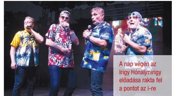
A nap végén az Irigy Hónaljmirigy előadása rakta fel a pontot az i-re