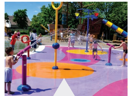
A nagy melegben a Tarzan™ Parkban a legnagyobb sikert a Placcs Placc aratta