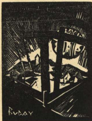
Buday György fametszete.