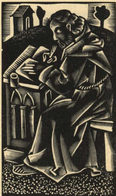
Molnár C. Pál fametszete.