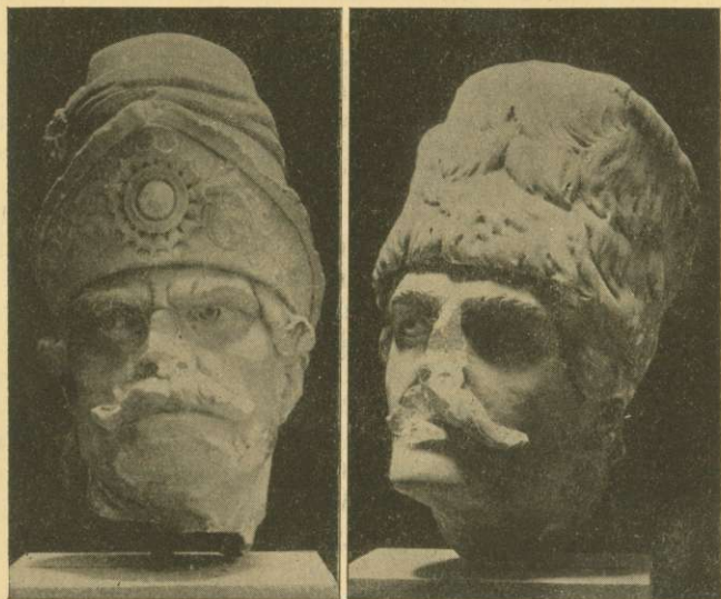
Töredékek Fadrusz János Mária Terézia szobráról.