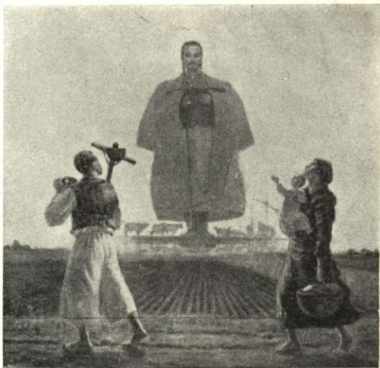
Fölföldy Mihály: Krisztus a pusztán (Cákó-Gáspártelep, Békés megye)