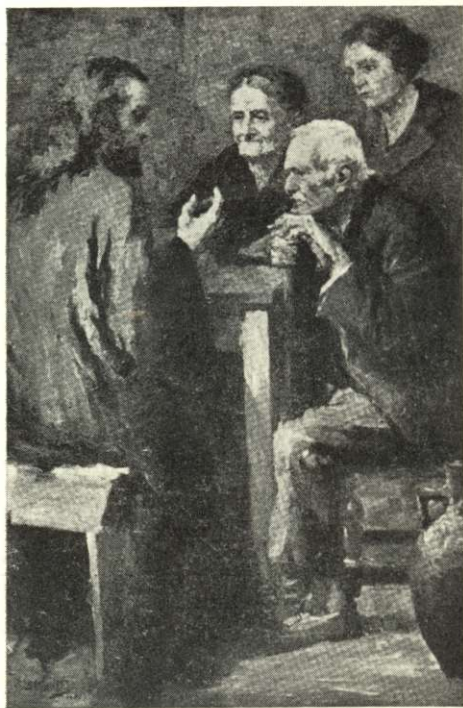
Spiro Vicatos: Prédikáció. (Modern Krisztus- ábrázolás a velencei biennálén)