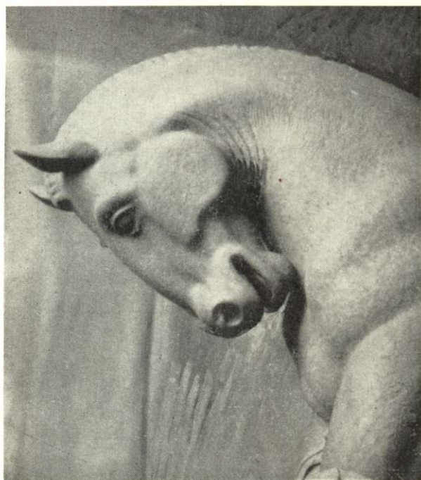
Cser Károly: Attila (részletek)