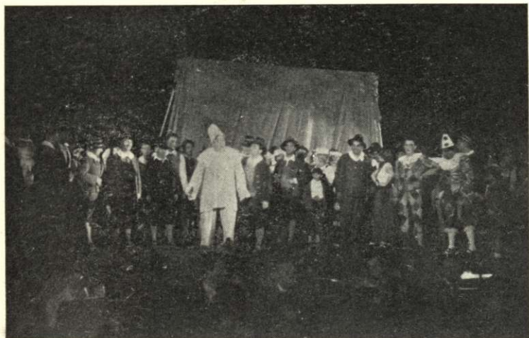
Margitszigeti Színpad: «Bajazzók». Középpütt: Aureliano Pertile