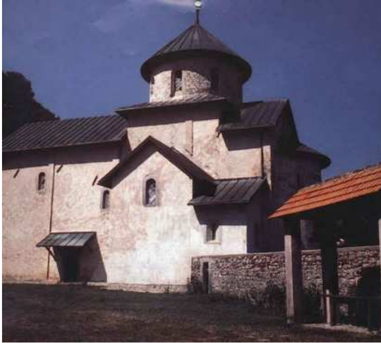
27. ábra: Moraca, Szent Szűz elszenderedése monostortemplom

„Éliás a zarefási özvegnél” című jelenetknél. A bejárati kapu feletti „Szűz Mária a kis Jézussal és két angyallal” című kép keletkezése is erre az időszakra datálható.