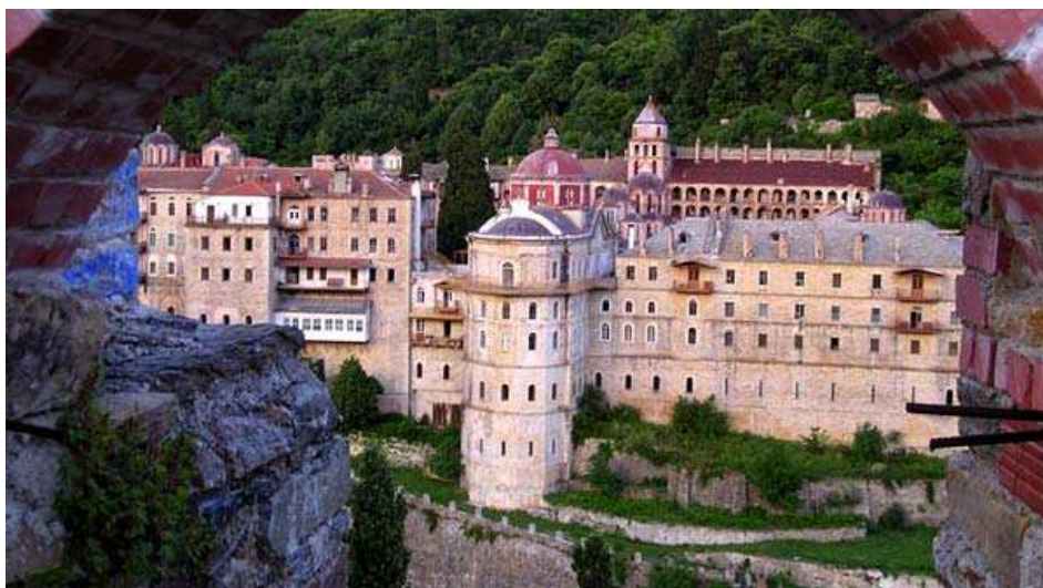
16. ábra: Athosz, kolostorok

A legfontosabb kolostorok a Megiszte Lavra, a Vatopedi, az Iviron, vagy a Protaton. A Megiszte Lavra volt az első nagy kolostor, amely 1060-ban készült el. Ezen rendház a többi együttes számára a mintát jelentette. A komplexum felépítése szerint négyszögletes alaprajzú, oldalán védelmi falakkal és lakószárnyakkal. A kelet–nyugati tengely mentén