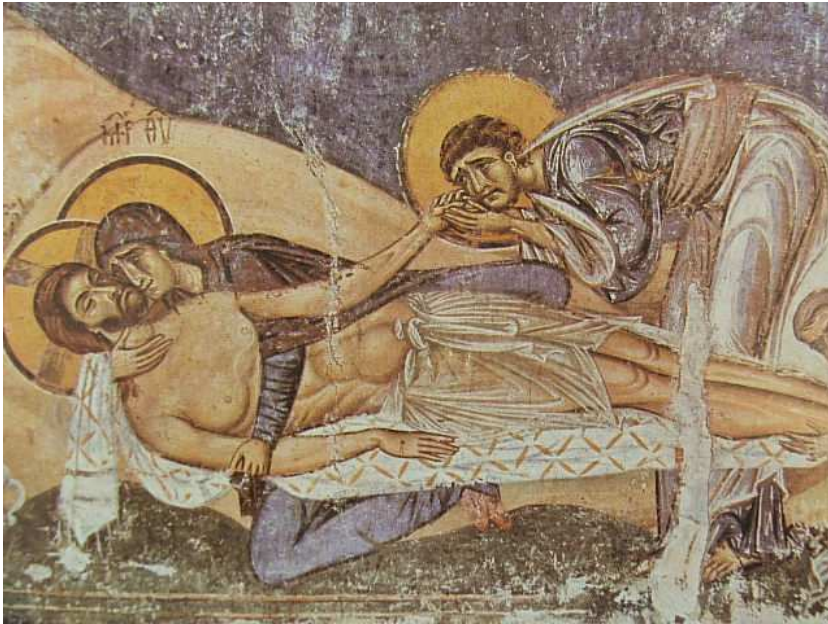
28. ábra: Nerezi Panteleimon templom, „Krisztus siratása” freskó

„Siratás”-on Mária, Nikodémosz, János, Arimetiai József vesznek részt. A halott testet Mária a kezében tartja, magához szorítja, könnyezve csókolja meg fia arcát. A fiatal János óvatosan emeli fel Krisztus bal kezét, Nikodémusz és Arimetiai János pedig a lábait csókolja. A konstantinápolyi mesterek átélhetővé, drámaivá tették a jelenetet, érezni az alakok belső szomorúságát és finom fájdmát továbbá, hogy minden szereplőnek közvetlen, meghitt viszonya van a halott Krisztussal. A gyász csöndes drámai megjelenítése az antik festői előképeket idézi, de már a gótikus emberideált is magában hordozza. A téma későbbi népszerűsége nyomon követhető a makedón freskók körében, így Kurbinovóban és Kastoriában is.