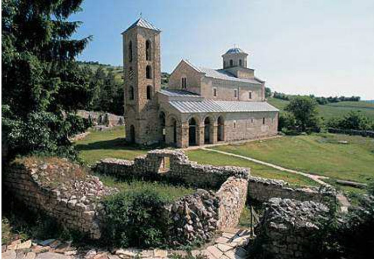
33. ábra: Sopočani, Monostortemplom

Sopočani, Monostortemplom: A szerb sopočani-i monostortemplom a freskófestészetéről nevezetes. I. Uroš 1265-ben alapította a templomot. A monostor főtemploma háromhajós, és narthexes. Később, a 14–15. században külső narthexet, illetve harangtornyot is kapott. A főhajó szentélyhez eső végét tambúron nyugvó félgömbkupola fedi.