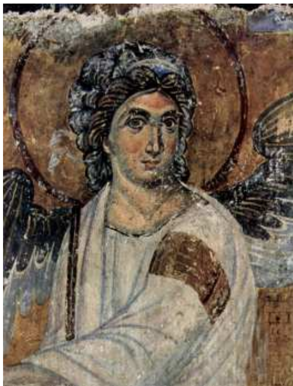
26. ábra: Mileseva, „Mi Urunk felemelkedése” kolostortemplom, Kenetvivő asszonyok freskó angyal alakja