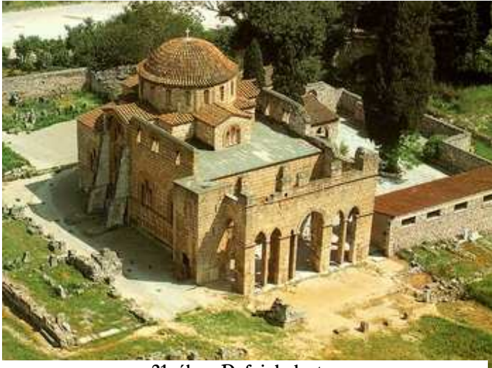
21. ábra: Dafni, kolostor

középtér felett nyolc pillérrel alátámasztott nyolcszöges dob tartja a hatalmas félgömbkupolát.