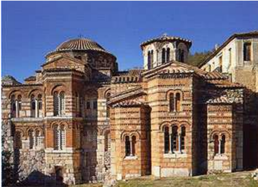
35. ábra: Sztirisz, Boldog Lukács kolostortemplom

Krisztusát ábrázolja. A Keresztrefeszített Jézust a Kozmosz szimbólumai ölelik körbe. A görögkeresztes tér kupolájának Pantokratora is kíséretet kap, angyalok mennyei serege között bíraskodik. A belső teret keresztológiai témák mellett Mária ciklusok egészítik ki. A mozaikok arcképei között a névadó Boldog Lukács is fellelhető, akinek a sírja az épülethez jobbról csatlakozik. A sztírishi mozaikok mesterei klasszicizáló módon, archaikusabb megformálással dolgoztak.