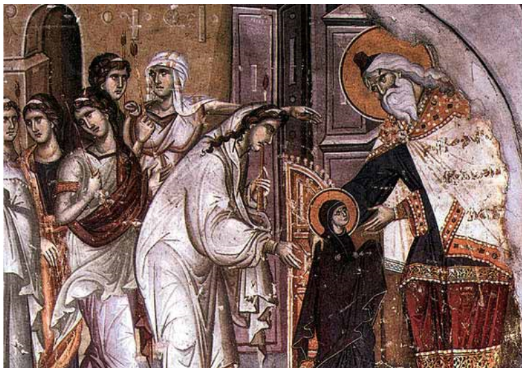
17. ábra: Athoszi kolostorok, Protaton, templom, A Szűz bemutatása freskó

Athosban a 13. és a 14. században a makedón iskola lendületes, realista freskókat készített, majd a 15.–16. században a krétai festőiskola térhatással, plasztikusabb megformálással és nagyobb színskálával dolgozott. Az ikonográfiai programot idővel az ún. „athoszi festőkönyv” határozta meg, amelyben például előírásként közlik, hogy a rendházak templomának főkupoláin a Pantokrátor Krisztusnak kell megjelennie. A festészeti ciklusok szempontjából érdemes külön megemlíteni a kariéi Protaton templom alkotásait. Az épület a „Szent Hegy fővárosában” áll és 14. századi freskódíszeiről nemcsak, hogy tudjuk, hogy a makedón iskolához köthetőek, de a mestert is pontosan ismerjük, aki Panszelinosz Manuel volt. 2 Ő készíthette a Vatopedi kolostor külső narthexnének a freskóit és a Nagy Lavra templom kupolája menti Szent Miklós fejet is, továbbá az említett két kolostor néhány harcos szentet ábrázoló (például Szent György) ikonját. A Protaton oldalfalainak képei Mária és Jézus életét mutatják be, illetve Pokol témájú freskókat is találunk közöttük. Panszelinosz stílusához mérten grandiózus kompozíciókat készít, fénylő, ragyogó hatású a kolorithasználata, világos és élénk vörösesbarna szíkontrasztjaival dolgozik. Az alakok nélkülözik a merev bizánci frontális beállításokat, a figurák meghajolnak, elfordulnak, a kompozíciók így dinamikussá válnak. A főmester egyéni stílusának vonásai különösen az apokrif irodalomból átvett Szűz bemutatása témájú freskón érzékelhető.