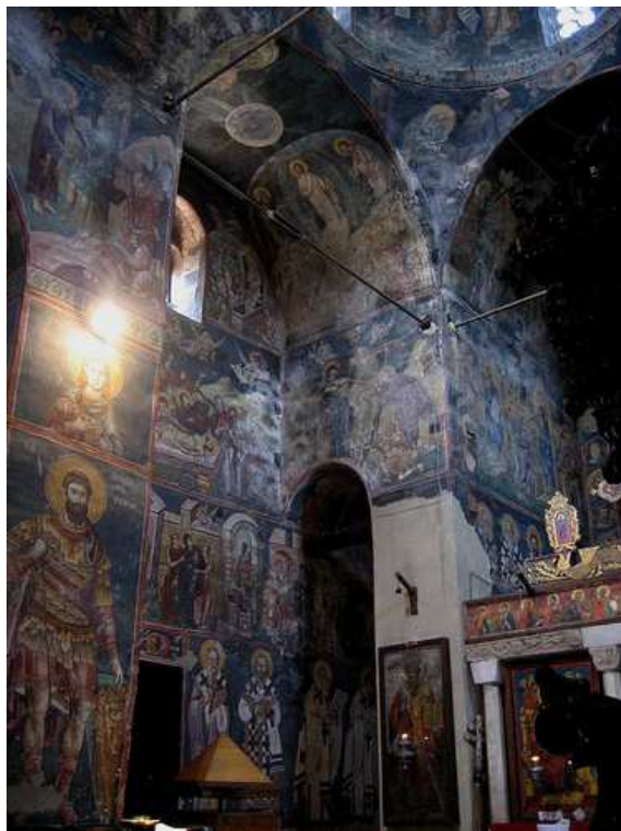
29. ábra: Ohrid, Szent Kelemen templom, belső tér

követendő példát jelentett a makedón és szerb területeken. A kupola közepén festett angyalok kíséretében hagyományos Pantokrátor ábrázolás tűnik fel. A dóm tambúrján és az