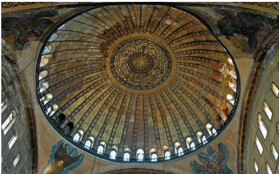
24. ábra: Isztambul, Hagia Sophia, kupola

„trónoló Istenanya ölében kis Jézussal” mozaik, amelyen a főszereplők Nagy Konstantint és