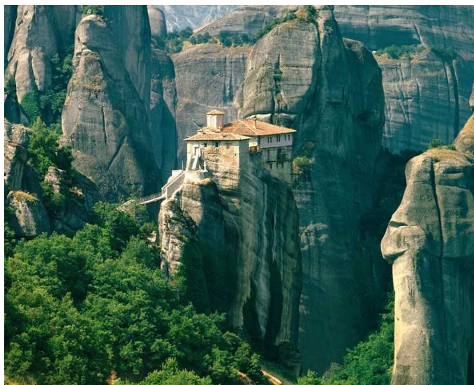
25. ábra: Meteórák, Roussanou kolostor

A kolostorok falait kőből, karzatait fából építették és cseréptetővel, belül pedig mennyezettel fedték őket. Az épületeket kezdetben hegyi meredek utakon, vagy téllétrán keresztül közelítették meg. A fénykor idején huszonnégy, ma öt rendház működik. A templomok falait egyöntetűen freskókkal díszítették, leghíresebbjei a pokol és a mártírok jeleneteit ábrázolják.