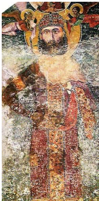
18. ábra: Bacskovo, monostor, temetőkápolna falán II. Iván arcképe

Bacskovo, Monostor: A bolgár nemesi alapítású bacskovoi monostor 1083-ban épült. Az alapító, Bakuri kaukázusi származású bizánci hadvezér és főnemes volt. Így a monostort a császártól és a patriarchátustól függetlenül működtette.