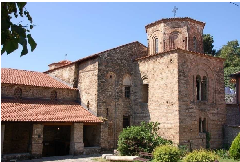
30. ábra: Ohrid, Szent Bölcsesség temploma

Ohrid, Szent Bölcsesség templom: A 10. vagy a 11. században épült ohridi Szent Bölcsesség templom a bazilika-szerkezetet követve egy széles és hosszúra nyúló főhajóhoz csatlakozik. Az egy-egy mellékhajót félköríves árkádsor és fent galéria választja szét. Utóbbi hajók félköríves apszissal záródnak. A főhajó szentélyének is ilyen a zárása, fedése azonban egy sokszögű kupola. Az épületet galériás narthex vezet be. A 10. század végére Ohrid lett a Bizánci Birodalom nyugati területének érseki székhelye, ehhez a tisztséghez méltóan épülhetett Ohrid legnagyobb temploma. Az egy századdal későbbi festészeti ciklus ugyanakkor az építés későbbi datálást bizonyíthatja. Mégis valószínű, hogy a 11. század közepén a katedrális már készen állott és a díszítést ekkor kezdték meg. Ezen makedón freskóegyüttes a templom valódi értéke, amely különleges ikonográfiai programját a kor egyik legtanultabb embereként számon tartott Leó érsek (1037–1056) határozta meg.