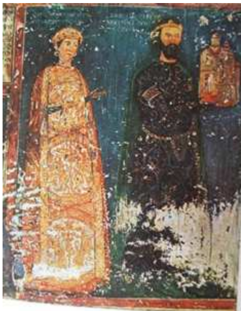
19. ábra: Bojana, Kalojan templom, Kalojant és Desziszlavát ábrázoló freskó

Bojana, Szent Miklós és Kalojan templom: A 11. században bolgár területen, a Szófia melletti Bojanában épült a kisméretű Szent Miklós templom. A templom négyzetes terét egy rövidszárú, tambúros kupola fedi. 1259-ben Kalojan szebasztokrátor, vagyis helyi uralkodó ehhez az épülethez csatolt hozzá egy új, róla elnevezett kétszintes templomot. Az épület a 11–12. századi konstantinápolyi építészettel mutat stíluspárhuzamokat. A templom görögkeresztes alaprajzú, centrális jellegű, keleti és nyugati irányban kissé megnyújtott. A Szent Miklós és Kalojan templom alsó szintje az alapítók kriptájaként funkcionált.