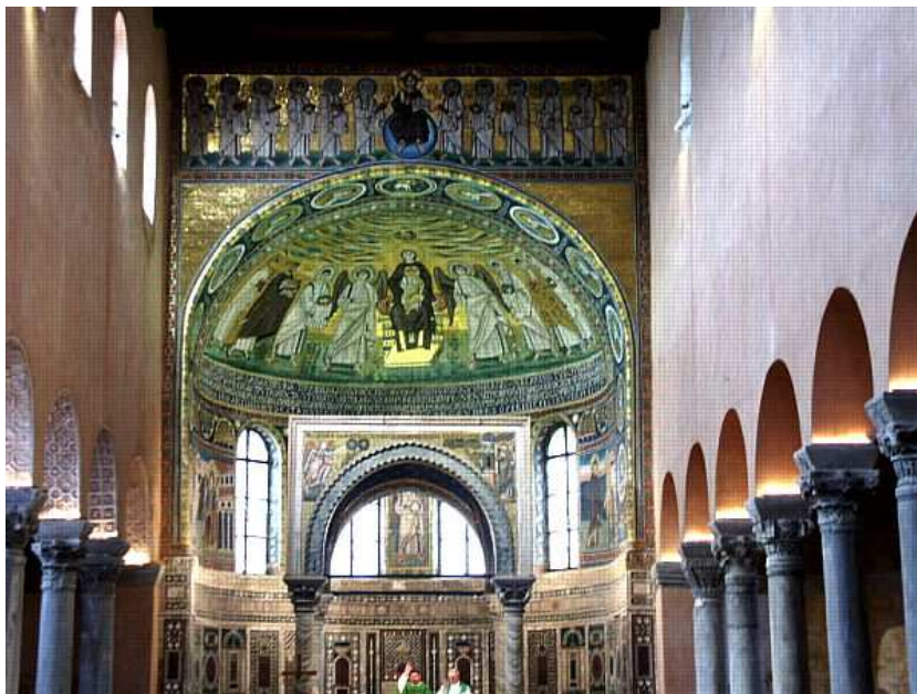
31. ábra: Porecs, Eufráziusz székesegyház, főhajó

Porecs, Eufráziusz székesegyház: A porecsi Szent Eufráziusz székesegyház elődje a 4. század második feléből származó Szent Maurus tiszteletére emelt bazilika volt. A korábbi épületnek az emlékét őrzi az új bazilika belső udvarán látható padlómozaik. A díszítés egyik