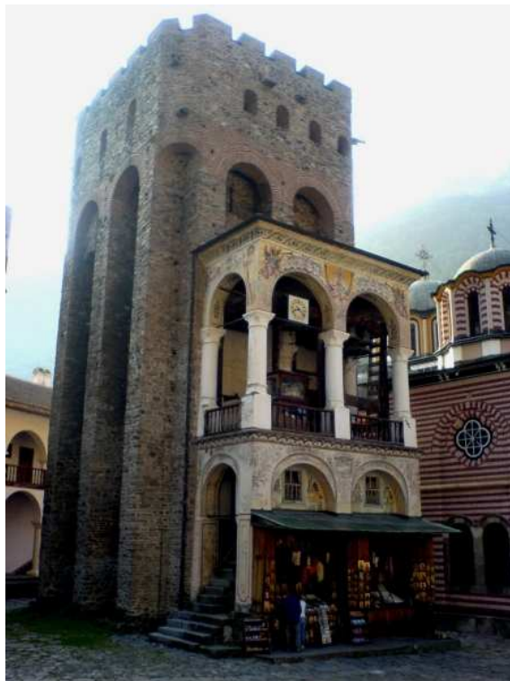
32. ábra: Rila, kolostor, Hreljo-torony

Rila, Kolostor: Ivan Rilszki, vagyis Rilai Szent János a 10. században remeteként a Rila-hegységben kolostort alapított, amely az évszázadok során a bolgár ortodox egyház legnépszerűbb kegyhelye lett Délnyugat-Bulgáriában. A legenda szerint János ereklyéi gyógyították meg a betegségéből I. Mánuel bizánci császárt (1143–1180) is.