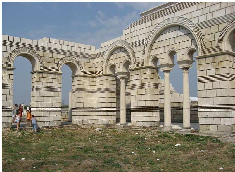
20. ábra: Pliszka, Bolgár Nagy Bazilika fennmaradt restaurált részei

Pliszka, Bolgár Nagy Bazilika: A bolgár Pliszka városa az I. Bolgár Birodalom (7.–9. század) fővárosaként szolgált, és Cirill és Metód munkásságának fő színtere is volt. Pliszka rangjához méltóan érseki palotával és a korszak leghatalmasabb délkelet-európai templomával dicsekedhetett, amelyet később „Bolgár Nagy Bazilika” névvel illettek. A