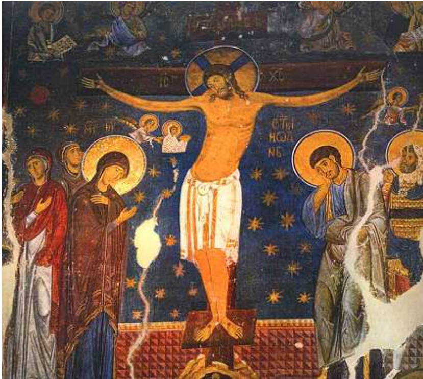
34. ábra: Studenica, Kolostor, „Keresztrefeszítés” freskó

A „Keresztrefeszítés” kompozíción a közép-bizánci kor felfogása érvényesül. A keresztrefeszített, már halott Jézus szeme csukott, feje előrebukik, sebeiből vér és víz folyik. A kép a képrombolók álláspontjához igazodik, vagyis a mester az említett módon Krisztus emberi természetét hangsúlyozza, a teljes passiót, fájdalmat érzékelteti.