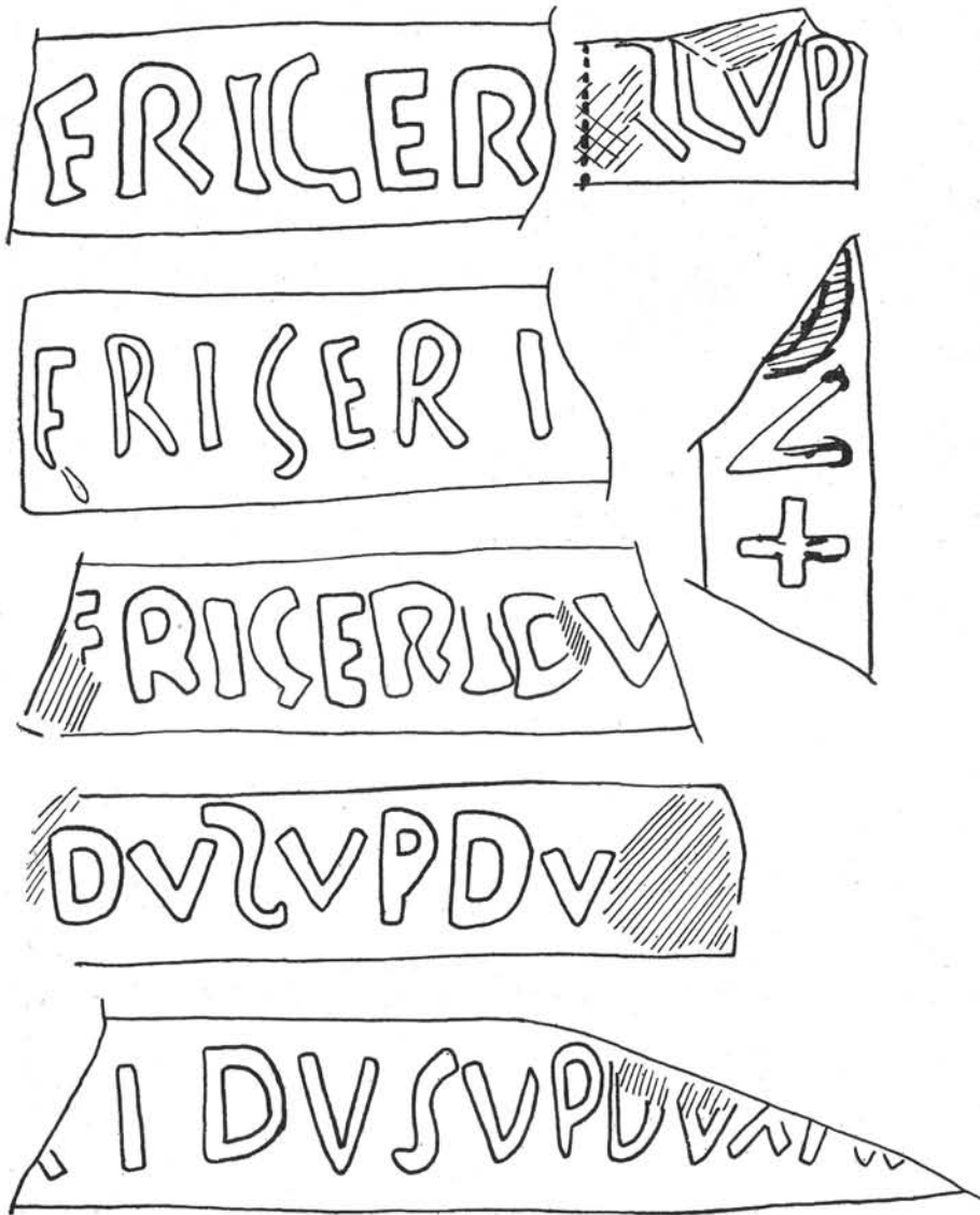
1. kép. A tabáni római őrtorony téglabélyegei.