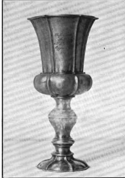
2. Goszmann György műve 1850-ből. Tiszaderzs. (Lásd: 37. sz.)