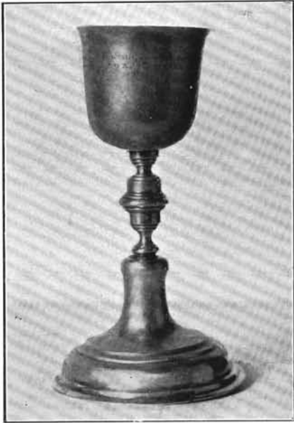
1. Zeller Ferenc műve 1798-ból. Heves. (Lásd : 10. sz.).