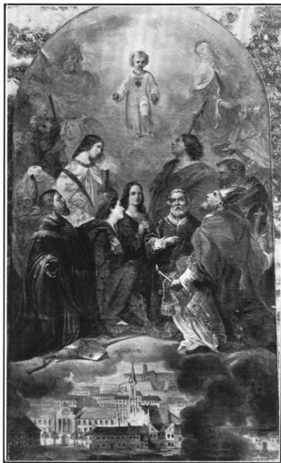
2. Pesky Ede: Az egyház segítői. 1864. (Budai kapucinusok rendháza.)