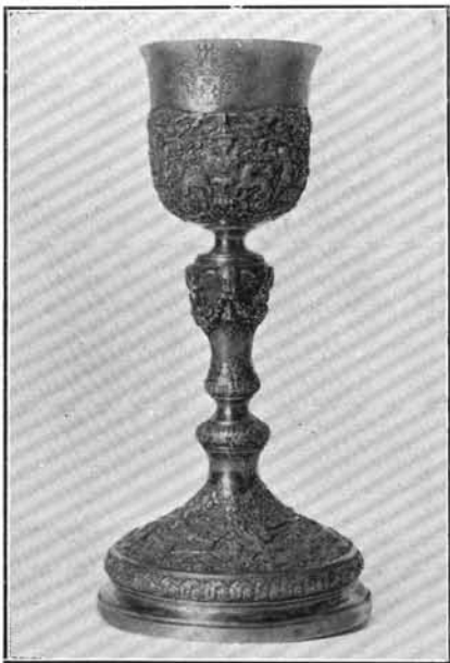
3. Szentpétery József műve 1811-ből. Szilvásvár. (Lásd : 12. sz.).