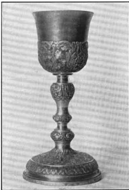
3. Szentpétery József műve 1845-ből. Szentmártonkáta. (Lásd: 36. sz.)