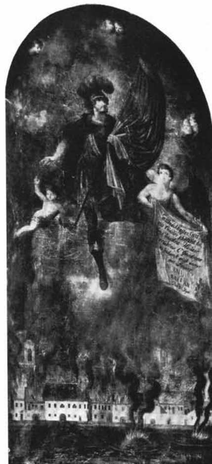
3. Szent Flórián. Oltárkép. (Tabáni plébániatemplom.)