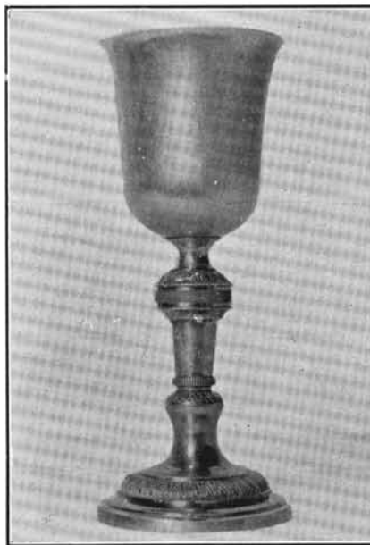
4. Paschberger Ferenc műve 1815-ből. Páty. (Lásd : 15. sz.).