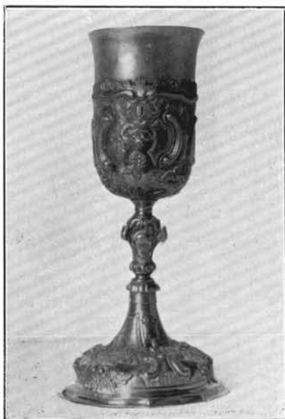
1. Dallinger Pál műve 1769-ből. Ócsa. (Lásd: 2. sz.)