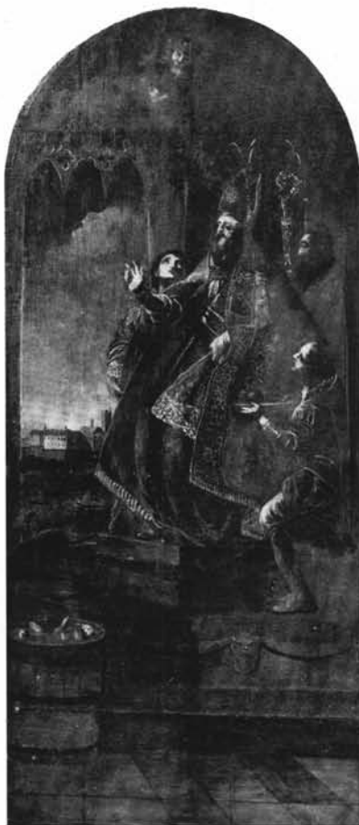
1. Szent Miklós. Oltárkép. (Budai ferencrendiek temploma.)