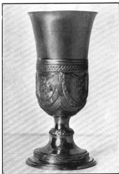
4. Paschberger Ferenc munkája 1797-ből. Fülöpszállás. (Lásd: 8. sz.)