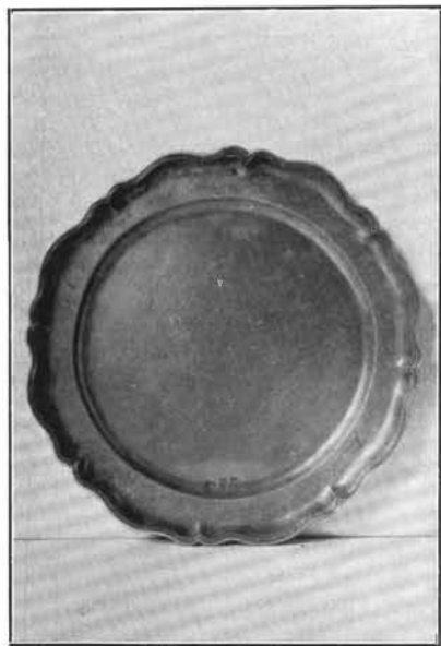
3. Cseh Pál műve 1865-ből. Karcag. (Lásd : 41. sz.)