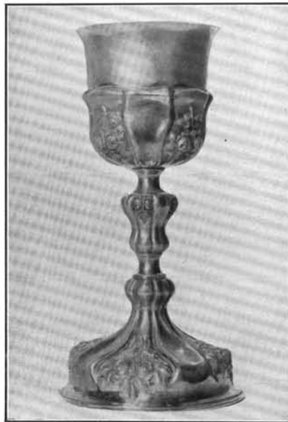
4. Laki Károly műve 1861-ből. Lepsény. (Lásd: 40. sz.)