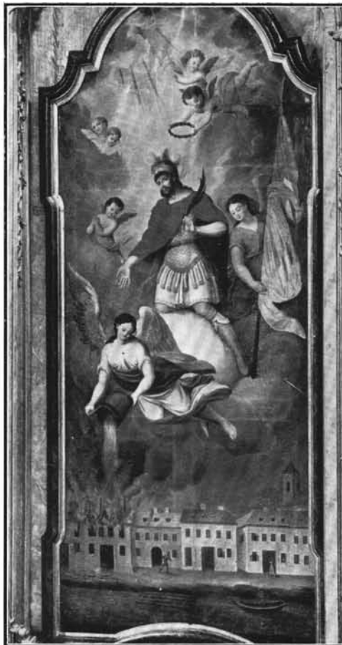
2. Held Károly : Szent Flórián. Oltárkép. 1829. (Budai Szent Erzsébet-apácák temploma.)