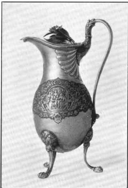
3. Szentpétery József műve 1824-ből. Budapest (Kálvin-tér). (Lásd: 28. sz.)