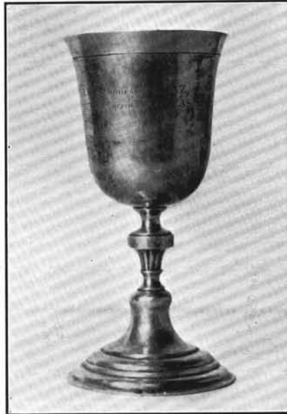
2. Paschberger Ferenc műve 1806-ból. Pomáz. (Lásd : 11. sz.).