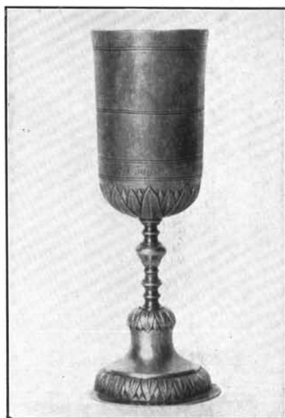
2. P. F. L. budai ötvös műve 1788-ból. Cece. (Lásd: 4. sz.)