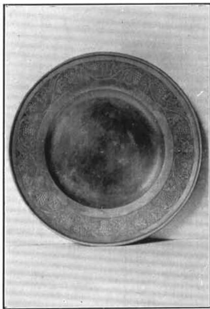
2. Szentpétery József műve 1832-ből. Abádszalók. (Lásd : 29. sz.)