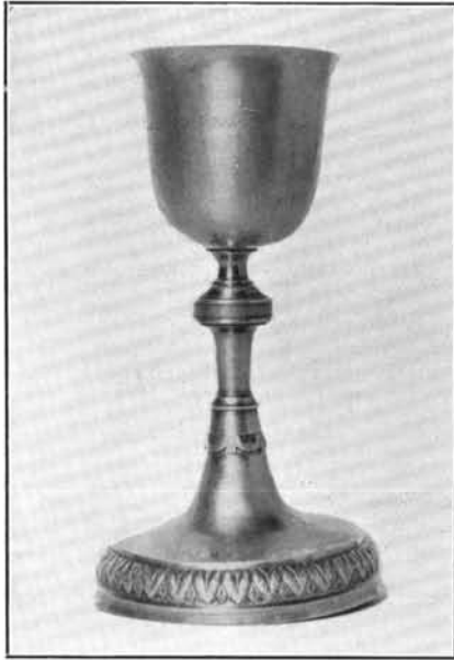
1. Trausel Domonkos műve 1817-ből. Nagyszokoly. (Lásd: 21. sz.)