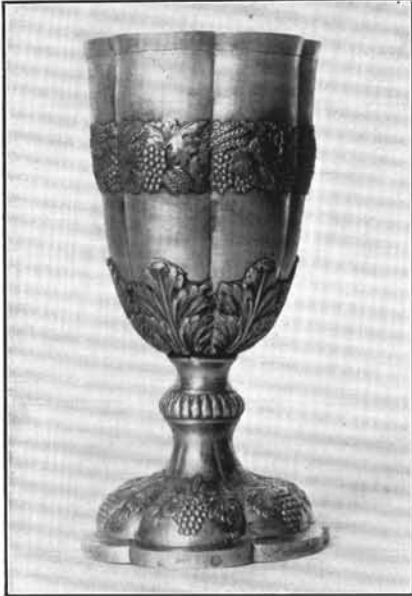
1. Szentpétery József műve 1842-ből. Hajdúböszörmény. (Lásd: 34. sz.)