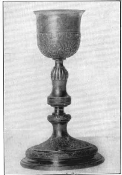
2. Prandtner műve 1824-ből. Felsőút. (Lásd: 26. sz.)