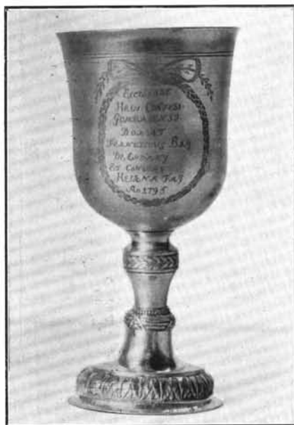
3. Paschberger Ferenc műve 1795-ből. Gomba. (Lásd: 6. sz.)