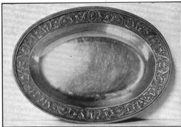
1. Szentpétery József műve 1824-ből. Budapest (Kálvin-tér). (Lásd : 27. sz.)