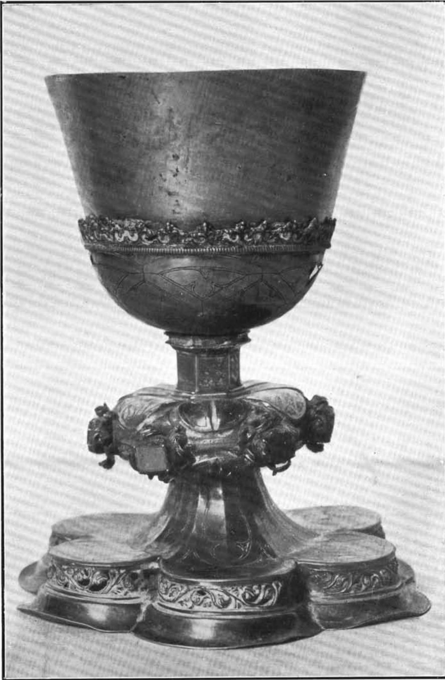
Gótikus kehely a XV. század végéről. A németjásfalvai úrmutató mesterének budai műhelyéből. Nagydorog. (Lásd: 1. sz.)