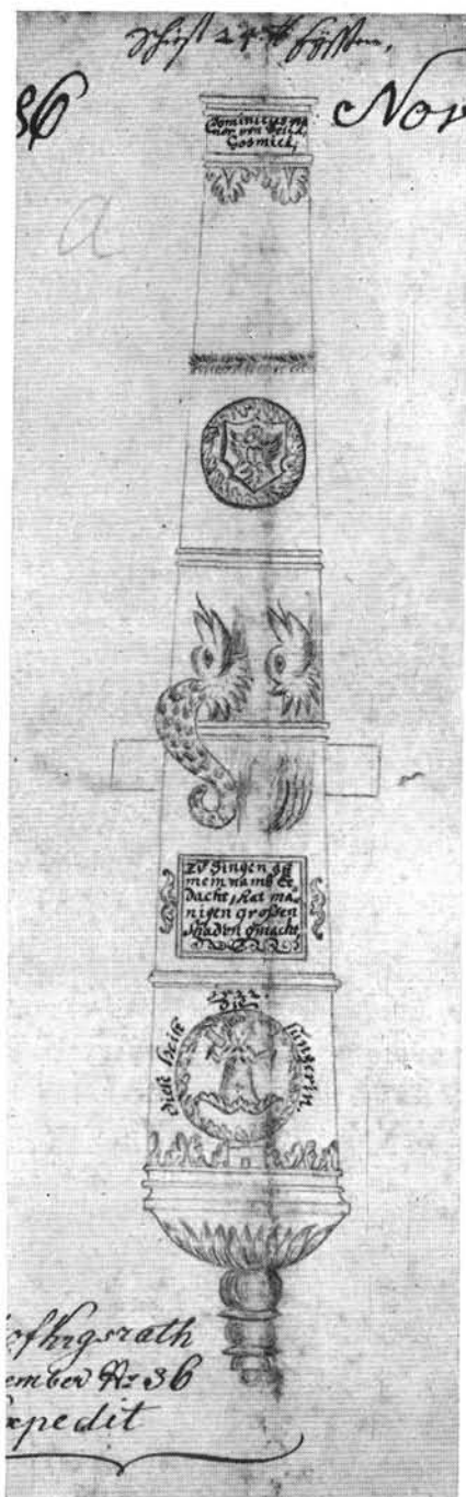
59. A visszafoglalás után Budán talált török és német ágyú rajza.