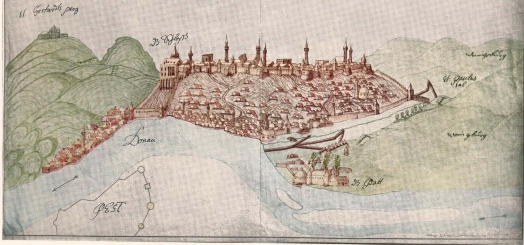
Buda látképe 1684-ben.

ade Ofen wie Pölben i 1657 gesehrt wie die Armee dancie geschicket von außgang zu froyen gestanden ist